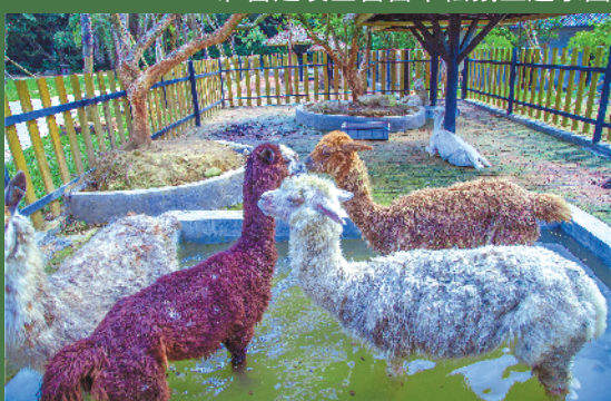
萌萌的羊驼估计会是未来的“流量明星”