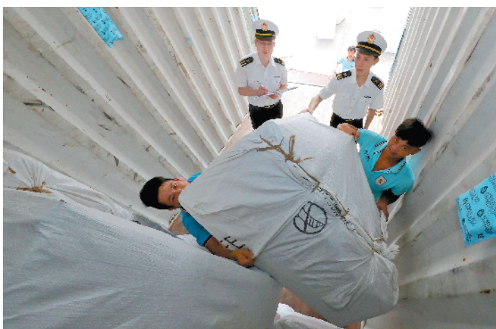
海关关员正在开展市场采购货物监管

“相对于传统的外贸业态，市场采购贸易方式实现了机制层面的‘内外贸一体化’：交易环节内贸化，物流环节外贸化。市场商户专注交易，采购商专注看样下单，出口环节、货物离境等专业问题由专业公司代理。”荔湾海关相关工作人员介绍，该贸易方式使中小微企业、个体工商户、境外小微采购商以“内贸”的形式参与“外贸”，使不具备国际贸易专业能力的中小微企业和个体工商户，也能便利地参与到国际贸易中来。