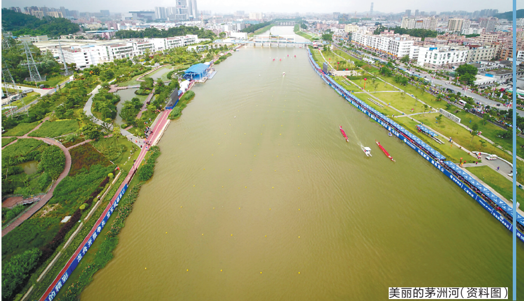
美丽的茅洲河（资料图）