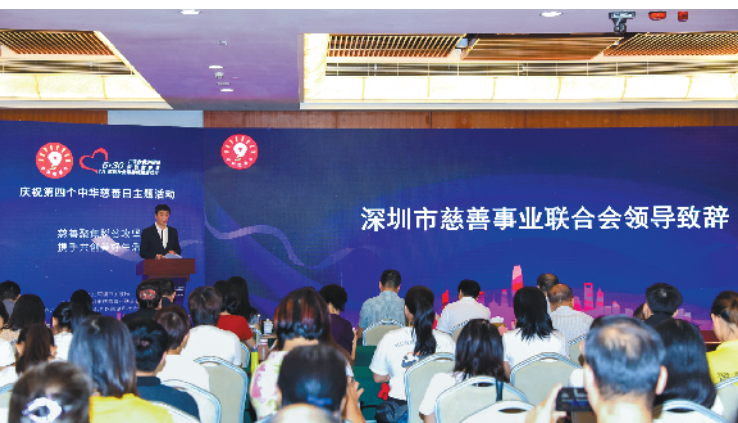
活动中共有10个慈善创新活动获得通报表扬

深圳慈善月“慈善活力社区”、“慈善活动优秀机构”、“慈善创新活动（项目）”名单。今年深圳慈善月期间，各慈善公益组织及社区围绕“慈善，让生活更美好”主题设计慈善月活动方案，深慈联共征集慈善月活动方案271项，涵盖“慈善+法律”、“慈善+环保”、“慈善+健康”、“慈善+教育”、“慈善+科技”、“慈善+社区”以及“慈善+文化”七大类型，同时加大帮扶力度，聚焦脱贫攻坚，充分体现了深圳市各界慈善力量立足社会需求，策划开展形式多样慈善活动的“全民慈善月”特色。活动中共有10个慈善创新活动、10个慈善活动优秀机构、15个慈善活力社区获得通报表扬。