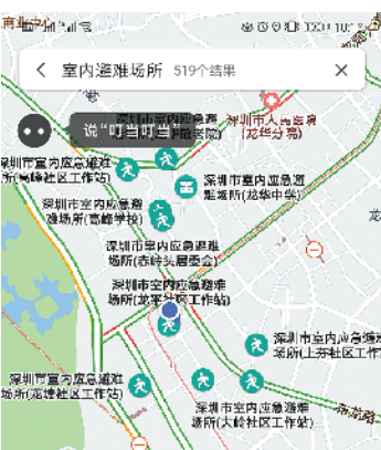
深圳市室内应急避难场所(龙平社... 深圳172处 龙华区大浪街道观澜社区565号社区... 深圳市室内应急避难场所(上芬小... 深圳900处 龙岗区横岗街道上海立交立交西首... 深圳市室内应急避难场所(南园社...)

羊城晚报讯 记者李晓旭、通讯员门艳报道：近日，腾讯地图联合深圳市应急管理局，在腾讯地图APP内上线运行深圳市室内应急避难场所查询和导航功能，帮助公众在灾害来临时，通过手机地图查询到相关信息，并及时导航到附近的室内应急避难场所防灾避险（见左图）。