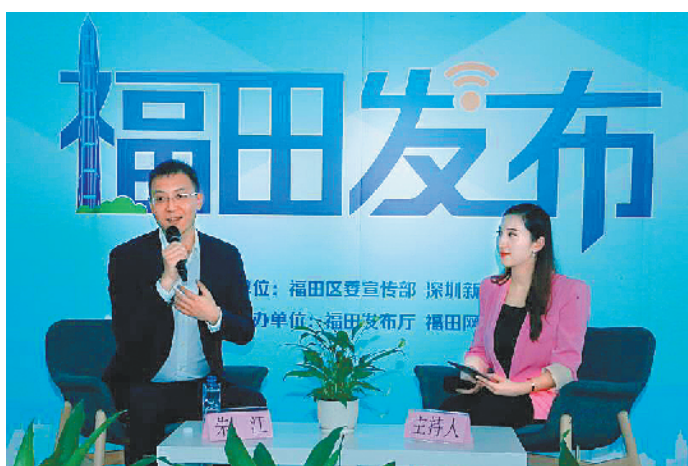
福田支持申报国家绿色金融改革创新试验区

羊城晚报讯 记者李天军摄影报道：在融媒体时代的环境下，传播方式发生了深刻变化，新闻舆论工作面临新的挑战。对此，福田区委宣传部于5日推出“福田发布”栏目，本栏目旨在通过福田区委区政府各单位“一把手”充当新闻发言