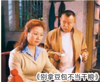
《别拿豆包不当干粮》