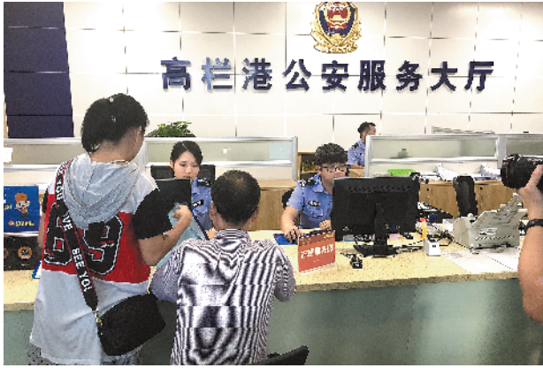
珠海高栏港公安服务大厅为群众提供便捷服务

2019 年珠海政府工作报告提出，要办好十件民生实事，其中包括提升基层派出所服务环境，推动窗口服务进驻各级行政服务中心。羊城晚报记者 10 日获悉，珠海高栏港警方将落实民生实事摆在重要位置，提前完成公安业务进驻政务服务中心的工作。在工作落实中，高栏警方探索最合理模式、创造最佳进驻条件、打造一流服务环境、配备骨干力量，得到了当地群众认可。