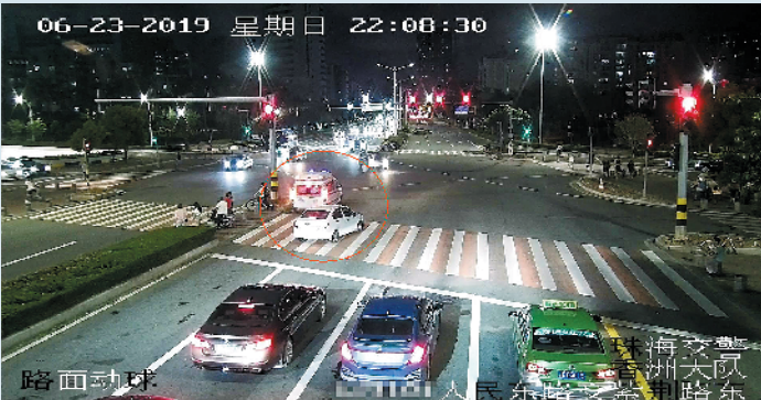
珠海司机礼让救护车的方式越来越专业

今年 6 月 23 日 22 时，一辆白色小车在人民东路紫荆路路口等红灯，准备左转进入柠溪路，后面刚好来了一辆救护车闪着警灯，司机将车开进路口，让出一条车道给救护车通过。7 月 10 日 11 时，一辆银白色小车在人民东路过胡湾湾路口行驶时，突然后面有一辆执行任务的救护车驶来，银白色小车司机立即压实线向左侧车道变道，给救护车让出一条路。上述两位司机在礼让救护车后，将当时情况发送给珠海交警微信后台，交警部门调取