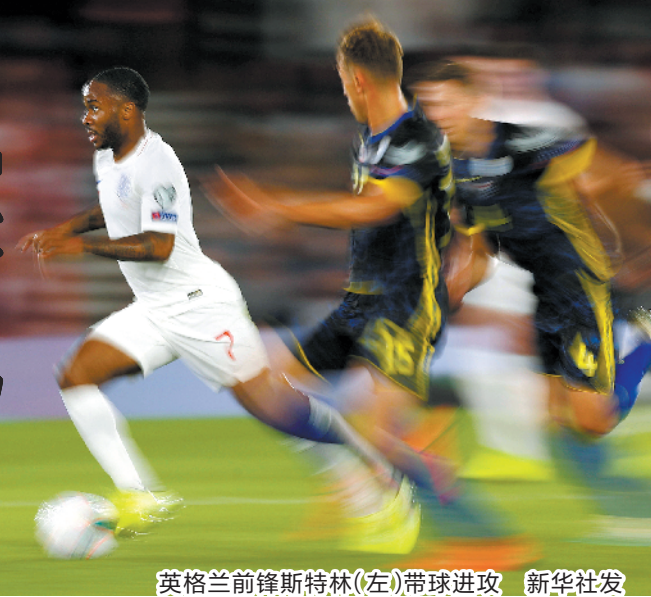
英格兰前锋斯特林(左)带球进攻

西班牙的出场阵容变化更大,也更不稳定,使得更多的球员有机会上阵,可见兵员来源之广泛,可用之人更多。即便如此,莫拉塔进4球、罗德里戈·莫雷诺和帕科各进3球,而中卫拉莫斯也进3球,西班牙的攻击群规模更大。比利时在欧预赛的场均进球数为3.16个,但仅失1球,是失球最少的球队。比利时沿用俄罗斯世界杯的基本班底,卢卡库在欧预赛已进4球,进3球的有阿扎尔和巴舒亚伊,德布劳内和默森都是进2球、3次助攻。比利时仍在享受俄罗斯世界杯留下的红利,毕竟多数骨干仍然当打,还能再踢几年。如今可说是比利时最佳时期,在欧预赛一路高歌也在情理之中。