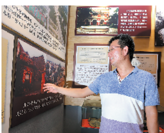
莫萃华后人讲述故居变化

1929年初,为了改造和争取土匪武装,莫萃华打进土匪队伍,在一次跟随队伍与国民党军队的战斗中不幸牺牲,时