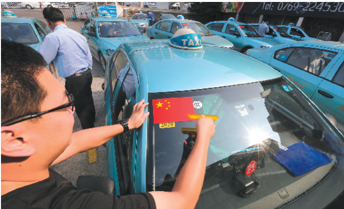
超过3000辆东莞出租汽车将陆续贴上国旗