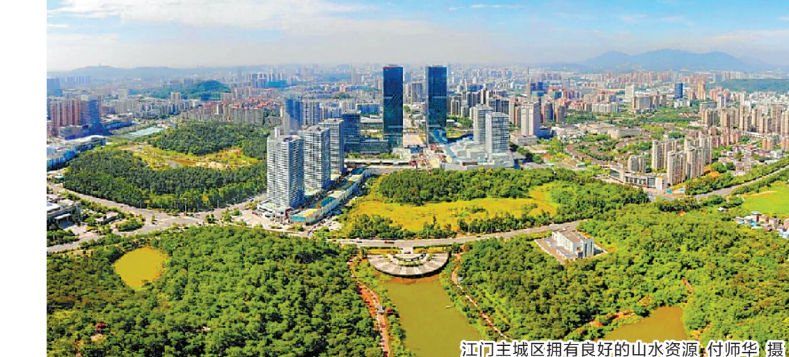
江门主城区拥有良好的山水资源

其中“一轴”是指江门大道景观主轴,《草案》提出在横贯东部三区一市的江门大道沿线打造江门最高品质的城市门户风光带,以主轴为中心向西向东以“西山东水”模式打造龙母山—体育中心—西江廊道、圭峰山—城央绿廊—西江