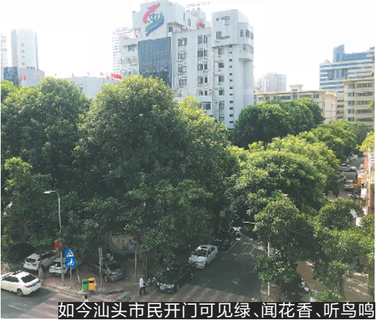
如今汕头市民开门可见绿、闻花香、听鸟鸣