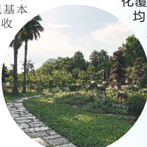
中山东路旁的绿化带给汕头披上绿的浓妆

据汕头市自然资源局的相关负责人介绍，按照《汕头市国家森林城市建设总体规划》，对照国家森林城市的申报条件，汕头市的 40 个考核指标已基本达标，申报考核验收的基础条件基本成熟。目前，汕头全市各级各部门正以高度一致的目标和积极的态度，上下联动，内外结合，多措并举，力争今年通过国家森林城市创建验收考核。