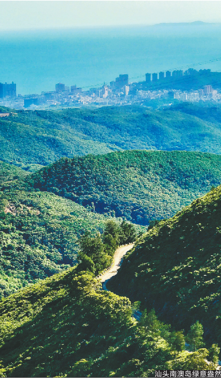
汕头南澳岛绿意盎然

根据汕头市自然资源局的统计数据显示，截至 2019 年 6 月，汕头市森林覆盖率 35.5%、城区绿化覆盖率 43.2%、城区人均公园绿地 15.19㎡，按照《汕头市国家森林城市建设总体规划》，对照国家森林城市的申报条件，汕头市的 40 个考核指标已基本达标，申报考核验收的基础条件基本成熟，有望于今年跻身“国家森林城市”行列。