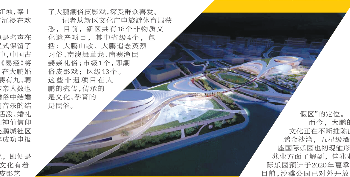
坝光文体中心效果图