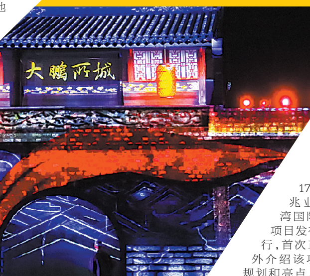
大鹏所城北门上演《南海风云》全息光影