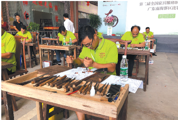
竞赛现场,选手们正在雕刻

羊城晚报讯 记者景瑾瑾、通讯员陈绍斌摄影报道: 10月14日,2019年中国技能大赛——第二届全国家具雕刻职业技能竞赛南海赛区“桂城杯”雕刻竞赛正式结束并在当晚举行颁奖仪式。此次比赛成绩排名前10%的选手将参加10月底举行的全国总决赛。