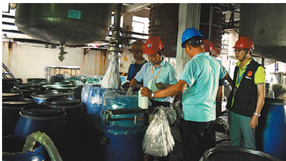
相关部门进行安全生产检查

经过多年发展,各类国家级、世界级的跳绳大赛中都有来自东风小学的小运动员的身影。为了继续擦亮勒流跳绳这张名片,今年,勒流将跳绳特色项目从东风小学、新球初级中学延伸到勒流中心小学。目前,勒流中心小学已经开展了跳绳大课间,培养学生的兴趣,为日后筛选和培育跳绳“种子”人才打基础。