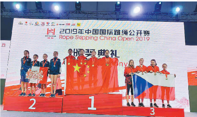
顺德选手登上领奖台

昨日,记者从顺德区勒流街道了解到,在不久前结束的2019年中国国际跳绳公开赛中,来自勒流的“跃动少年”花样跳绳队表现突出,夺得了11项冠军、7项亚军和2项季军。