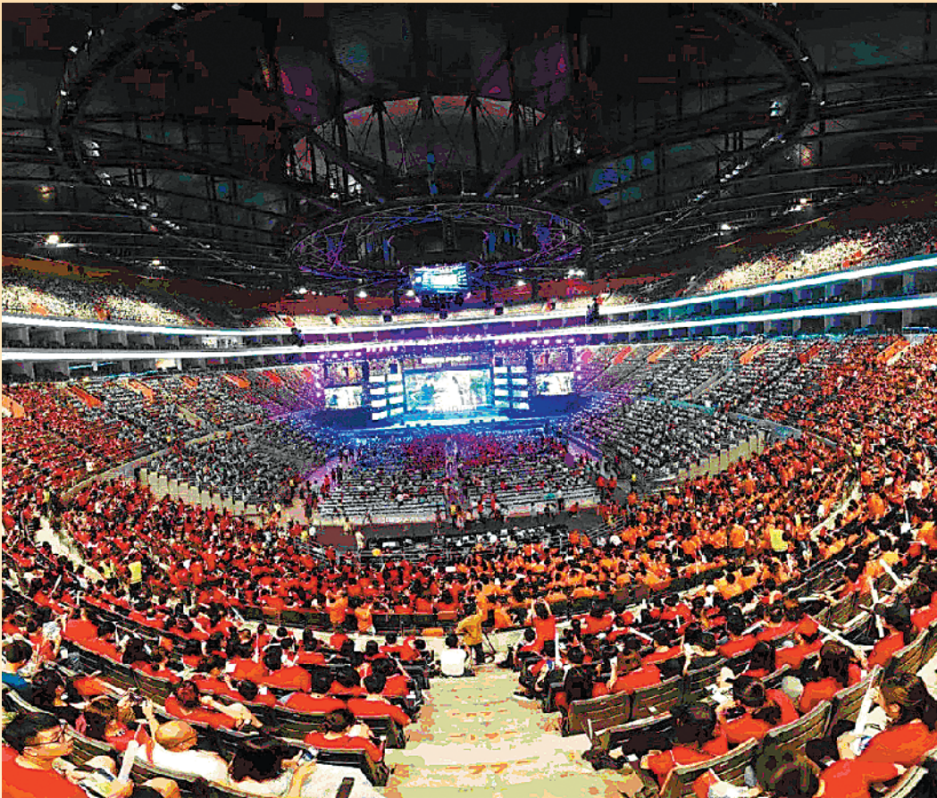
平安人寿万人盛典

10月19日，平安人寿东莞中心支公司首届万人盛典于东莞篮球中心首度燃情上演，近万名保险销售精英及公司管理骨干出席本次活动。