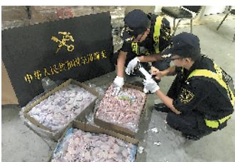
皇岗海关查获的走私未经检疫冻品

羊城晚报讯 记者宋王群,通讯员刘婕、邓焱、朱丽娜摄影报道:10月21日,据深圳海关消息,10月17日,该关所属皇岗海关在皇岗口岸货运入境通道,连续查获两辆货车通过伪报品名走私来自巴西未经检疫的冻鸡翅和冻鸡爪,共计36吨。 当晚,两辆粤港两地牌货车经皇岗口岸货运通道入境时,被列为查验对象。查验人员对其进行大型X光机检测时发现图像中货品区域与实际申报货物不符,随即对其进行开箱查验。 经查验,上述两车均以一般贸易方式申报进口“ABS塑胶粒”,关员查验时并未发现相关货物,而在车厢内发现大量未经