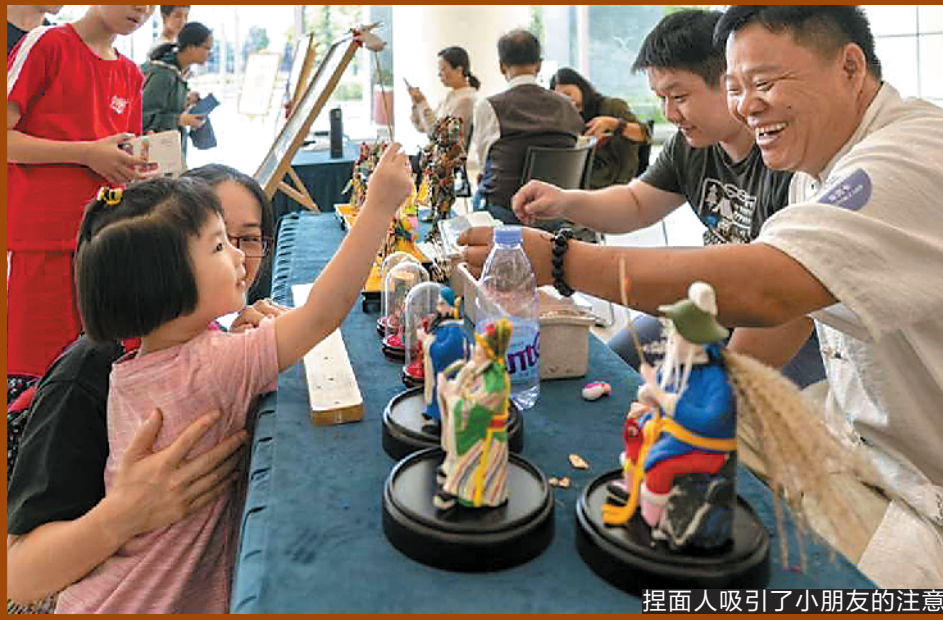
捏面人吸引了小朋友的注意