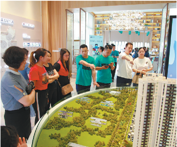
热销盘前期集中放量成交

此外，从认购情况来看，上周认购量环比上升3%，但仍处于年内中位水平。这是由于热销盘前期集中放量成交，后期缺乏新增供应，多数热销项目存量不多；并且各项目营销力度减弱，置业消费入市谨慎。