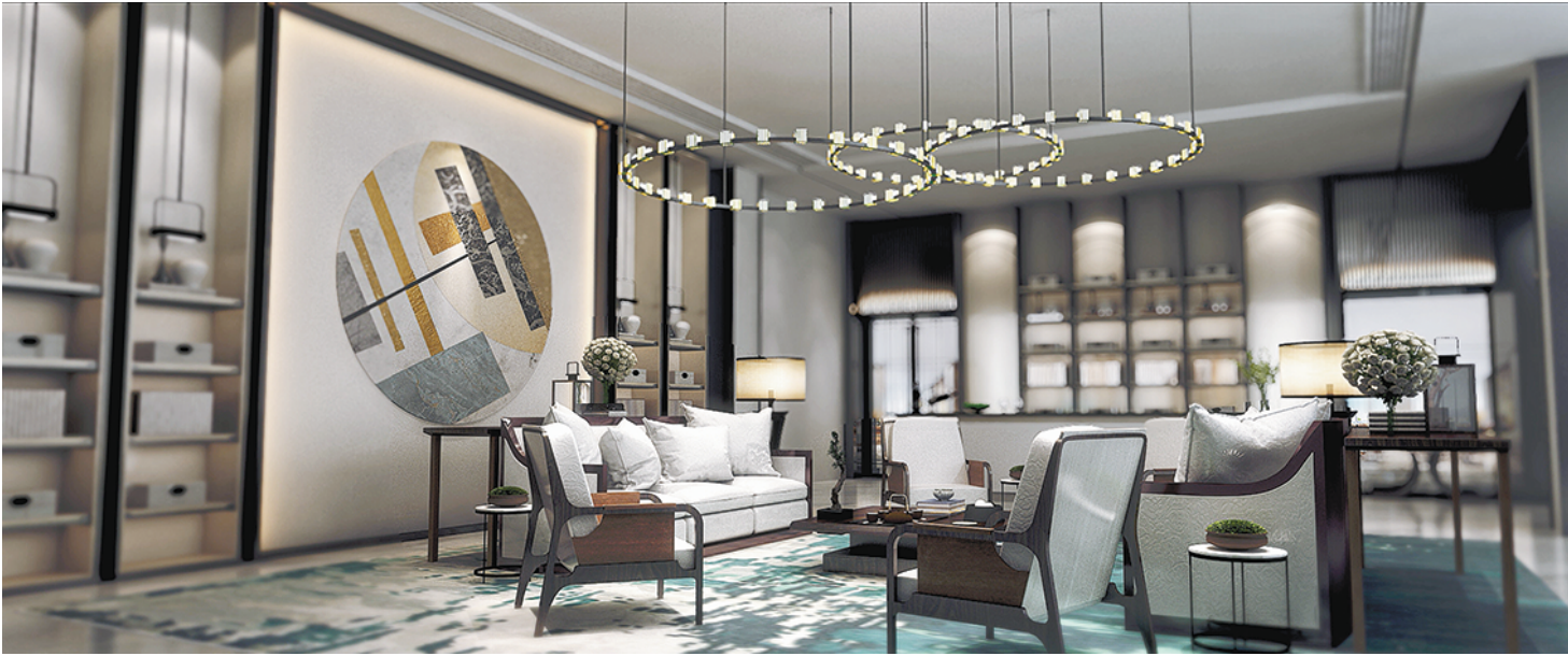
楼盘客厅多智能化单品(资料图)

当然这一切都离不开智能家居的助力。据了解，随着东莞市场上精装房交付的楼盘越来越多，部分品牌房企引进的“智能社区”模式，在带给业主便利的同时，更促进了智能化潮流的兴起。