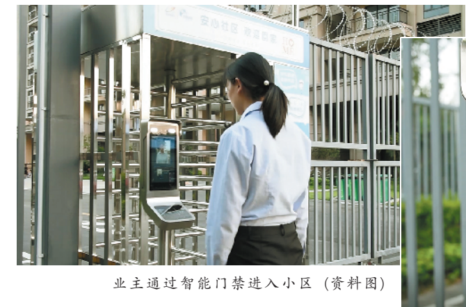
业主通过智能门禁进入小区（资料图）