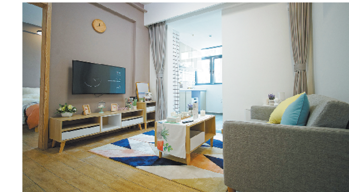
市场上精装房交付的楼盘越来越多(资料图)

居住的智能化时，往往楼宇对讲、监控、可视对讲、门禁、停车系统等公共设施称为智能化，这些都还属于外部品质。新智能楼盘对开发商的要求很高，一方面增加了开发成本，另一方面还需要考虑后期如何维护。事实上，引入智能家居系统，打造智慧小区对于房企来说也不是一件简单的事情。