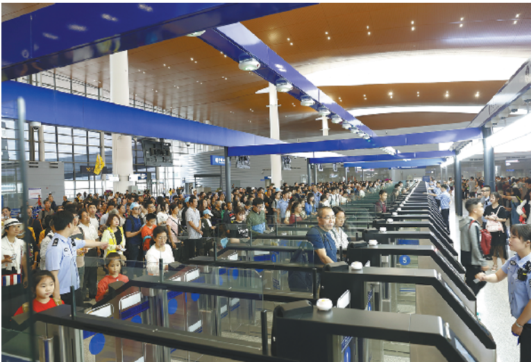
大量游客通过港珠澳大桥口岸出入境