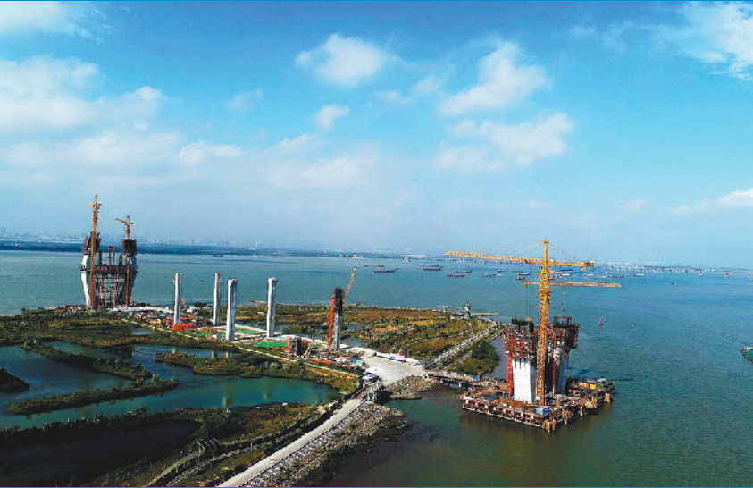
正在建设中的洪鹤大桥

此外，伶仃洋（深珠）通道是连接珠江东西两岸的重要通道，目前，省交通运输厅正在组织开展伶仃洋通道工程可行性研究工作。珠海交通部门相关负责人表示，珠海还将加强与深中通道的衔接，进一步研究与协调广州城市规划延伸至珠海澳门的规划方案，在珠海北打造集高铁、城际铁路、市域轨道、城市轨道交通的珠海北站综合交通枢纽。