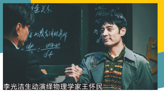
李光洁生动演绎物理学家王怀民