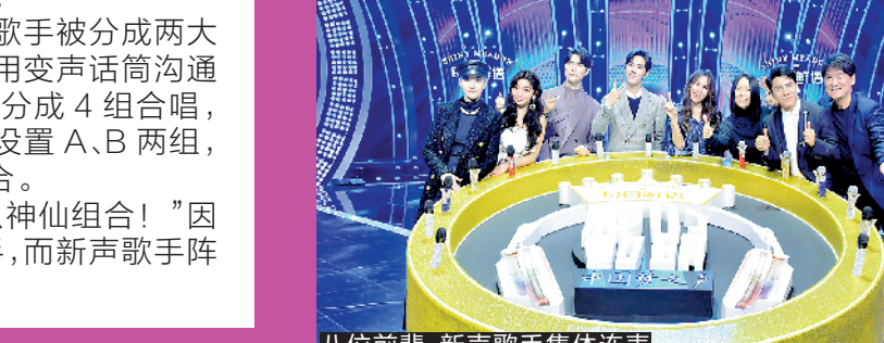
八位前辈、新声歌手集体连麦

音乐竞演综艺《中国梦之声·我们的歌》上周日晚在东方卫视首播,口碑不俗,当晚有5个相关话题登上热搜榜。节目创造了盲选配对赛制:前辈歌手和新声歌手被分成两大阵营;在只能看到对方阵营歌手投影轮廓、且只能用变声话筒沟通的情况下,两大阵营的8位歌手完成“盲猜配对”,分成4组合唱,唱完歌后完成正式互选配对,结成师徒……节目设置A、B两组,共16位8组歌手,10期竞演后,决出冠军师徒组合。歌手阵容公布后,不少观众感慨:“这都是什么神仙组合!”因为前辈歌手阵容中不乏那英、周华健等重量级歌手,而新声歌手阵容中则有肖战这种“顶级流量”。