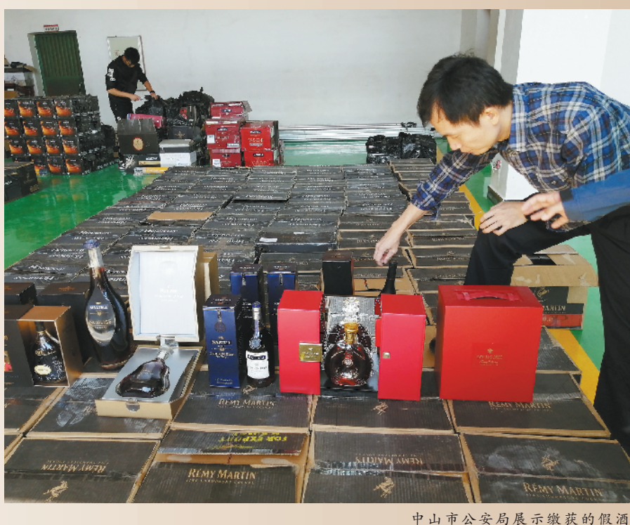
中山市公安局展示缴获的假酒

办案民警表示，通常造假酒者是从酒楼等渠道买入用过的空酒瓶和包装盒，再灌入假酒，因此通常包装看起来比较旧。但是，单凭目测消费者比较难分辨，建议消费者从正规渠道购买，以免上当受骗。