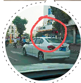
4岁小孩一路将头伸出天窗