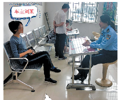
港口交警循线传唤当事人家属

香洲区市场监管局相关负责人介绍，该局委托第三方农产品快速检测机构对香洲区53家农贸市场和8家超市开展食用农产品快检，每天随机选取部分农贸市场及超市进行快检；同时30家农贸市场和8家超市自行开展快检。据了解，联合整治行动将持续到11月底，广大群众可对食品生产经营环节违法违规线索进行举报，电话：12345、12315。