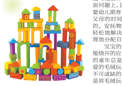
毛绒玩具——给孩子安全感

还有不到两周的时间,电商平台的“双11”购物活动就要到来。作为新手爸妈们,如今在这种“买买买”的日子里可能不想着自己了,要为宝宝们囤点用品。本期我们要说的便是孩子成长和早期教育中不可或缺的一部分——玩具。新手爸妈们,你的购物车应该有以下这些。