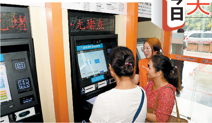
市民体验使用自助终端办理政务

系统18个,拉通数据对接应用132个,实现“一网通办、业务通、数据通”,其中自主开发的不动产登记综合受理系统,实现与不动产登记系统、住建部门网签系统、税务部门“金三”系统等11个系统对接、信息共享互认。