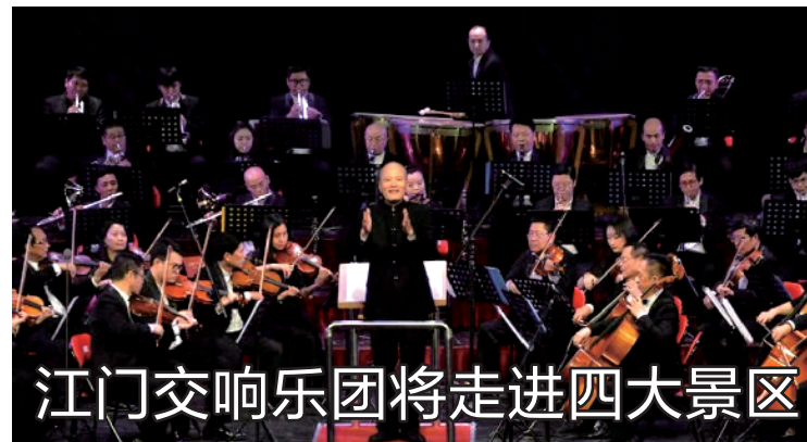
江门交响乐团将走进四大景区

据悉,横琴综合管廊项目为“获奖大户”,曾获得珠海市优良样板工程、广东省优良样板工程、冶金行业优质工程奖等多个奖项。2017年,综合管廊工程项目荣获全国首个综合管廊鲁班奖,近日,该项目又荣获第十七届中国土木工程詹天佑奖。至此,该项目荣获两个建筑领域国家级最高奖项。