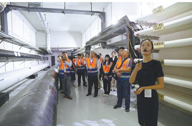
公众参观横琴综合管廊

尤其值得一提的是以往办事需要跑多个窗口、递交多份资料、等候时间久的不动产登记事项,得益于“政务上云”,相关部门打造了“一体”不动产登记综合受理平台(系统),在保留原有各审批系统的基础上,实现部门数据交互互认与实时共享,实现一网通办审批。目前,只要跑一个窗口,甚至在网上或自助终端办理,不需提交纸质资料,商品房(一手、二手)交易涉及缴税、办证等整个流程最快24小时内可办结,其中涉税非涉证业务甚至可以在两小时内办结。记者了解到,该项改革还因其创新性、便捷性和显著成效,入选“中国‘互联网’优秀案例50强”。