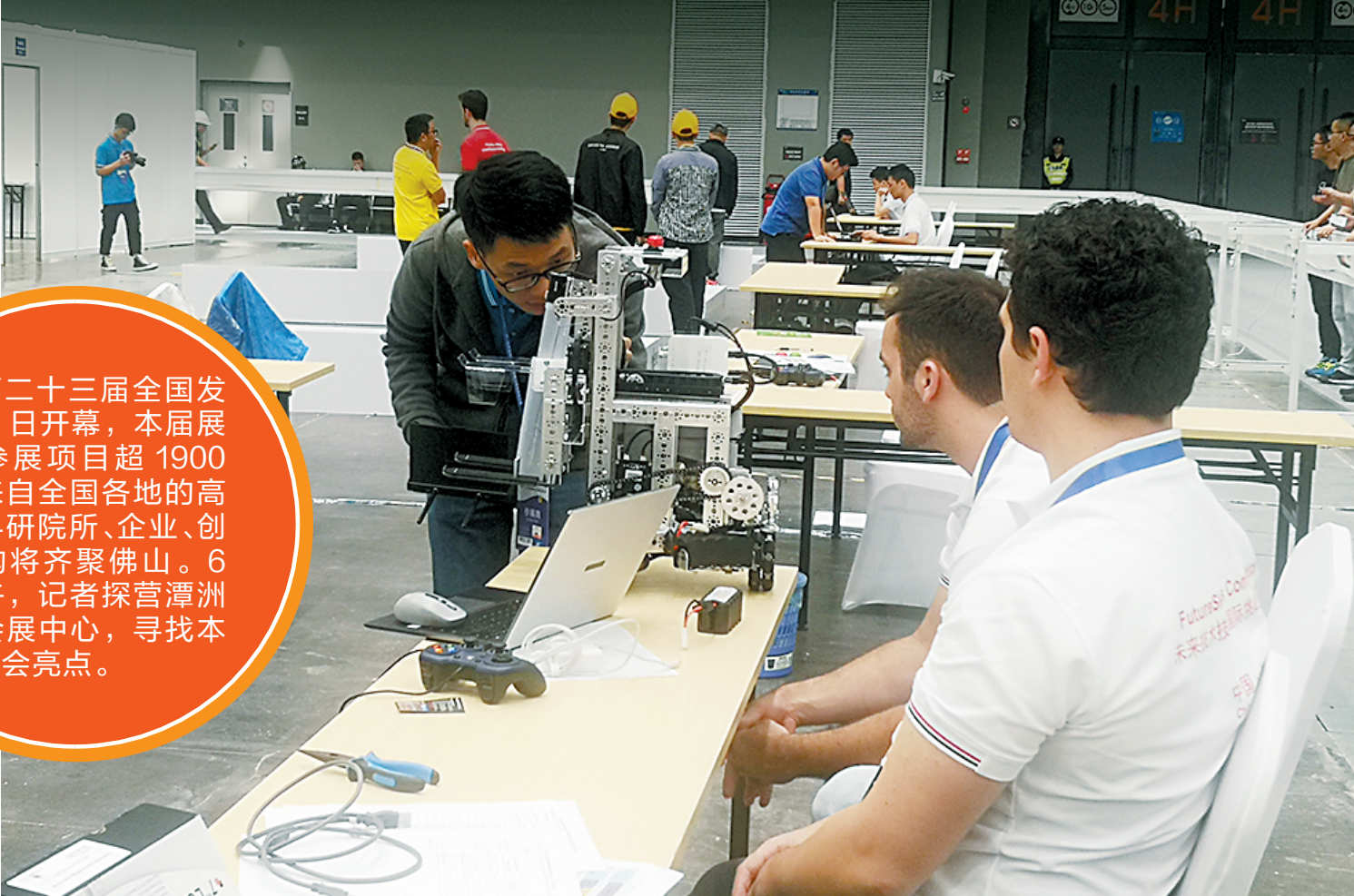
参展选手在调试发明作品

记者了解到，“第二十三届全国发明展览会——一带一路暨金砖国家技能发展与技术创新大赛佛山未来技术技能国际挑战赛暨俄罗斯喀山数字技能大赛选拔赛”(以下简称佛山未来技术技能国际挑战赛)将于11月6日-9日在潭洲国际会展中心同期举行。佛山未来技术技能国际挑战赛将设置无人机操作、工业机器人、机器学习与