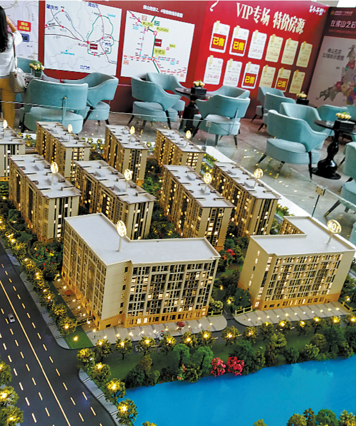
为在禅城区稳定就业的青年职工家庭提供过渡性公共租赁住房(图文无关)