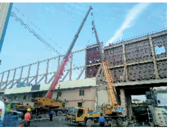
现场正有序进行拆除

验。近日，随着吊车进场，广告拆除正式开始。经过近4天的连续施工，南庄城管部门成功完成了位于西樵大桥南侧企业近1600m²大型破损广告牌的拆除和清运工作，及时消除了安全隐患。