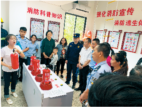
↑讲解员为居民现场讲解如何使用灭火器