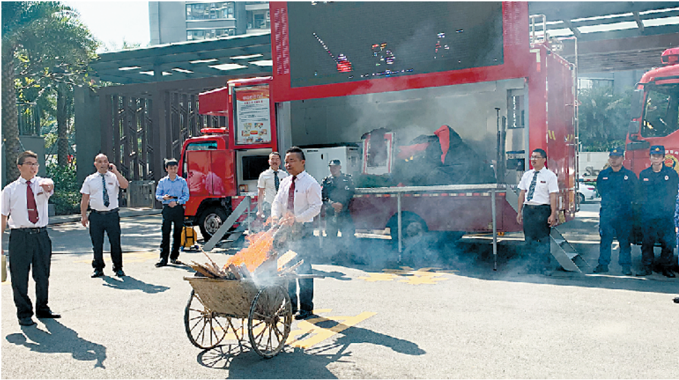
→社区居民真实体验用灭火器灭火

11月7日上午10时,珠海湾仔街道“消防安全进社区”活动在华发峰景湾消防宣传体验馆内举行,这是湾仔社区首个消防体验馆,将面向社区居民开放。