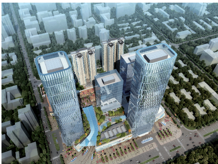
绿地金融中心—月星环球港项目整体效果图

据悉，今年以来，祖庙街道坚持“项目为王”，有 11 个纳入到禅城区贯彻落实粤港澳大湾区发展规划纲要的重点项目，纳入一环创新圈项目 3 个，投资总额超过 170 亿元。截至 9 月，招商引资重大项目 11 个，计划投资总额 45.99 亿元。新设（增资）合同外