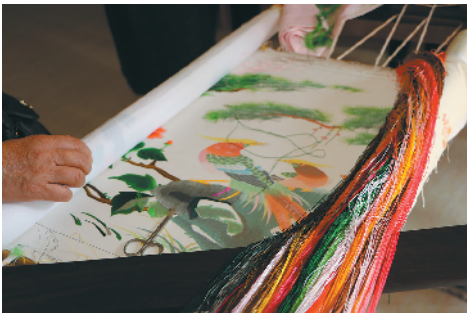
绣架上，正在创作中的刺绣作品

桂城石碁有一群资深绣女，她们大多已步入花甲之年 前不久，石碁广绣入选第七批市级非遗名录