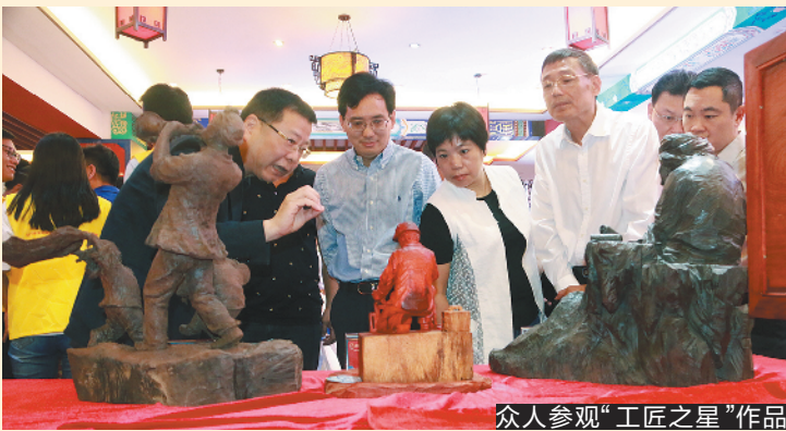
众人参观“工匠之星”作品

红木“发源地”,不忘“初心”“重整行装再出发”,推动红木产业向“高质量、创品牌”发展;首次延长竞赛产业链,将竞赛与观澜文化特色小镇、“中国观澜国际红木文化节”紧密衔接,面向全国展示观澜红木的独特魅力;参赛选手已扩展到浙江、福建、河北、陕西、广东等十多个