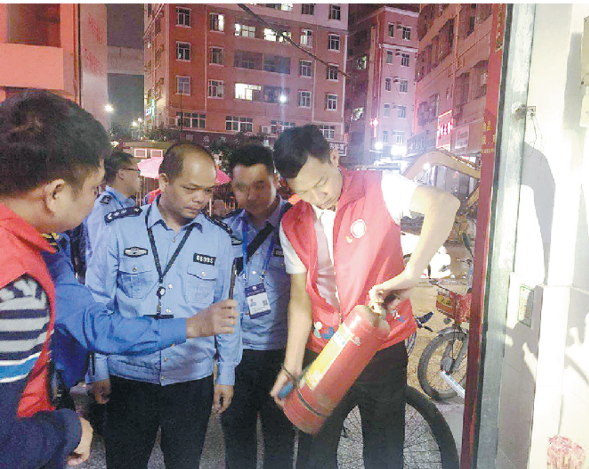
开展城中村环境综合治理,提升公共安全水平

薯田埔社区党委坚持问题导向,聚焦短板软肋,投入大量人力物力开展城中村环境综合治理,大力提升公共安全水平,努力营造“安全发展”大环境。2019年2月28日至2019年10月8日,开展“燃气安全排查”专项行动62次,发现燃气安全隐患10020处;每周开展“三小”场所、村民自建房消防安全隐患排查整治行动一行,共整治危险用火245处;开展清理乱堆放、拆除违规乱搭建等专项整治行动,共拆除违规乱搭建645间9667平方米。