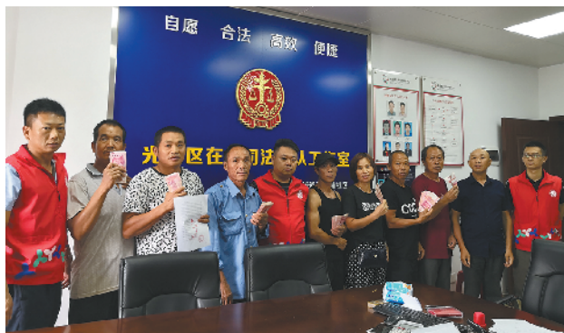
薯田埔社区创新人民调解,将矛盾化解在基层