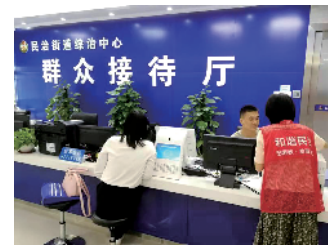
禁毒宣传不断深入