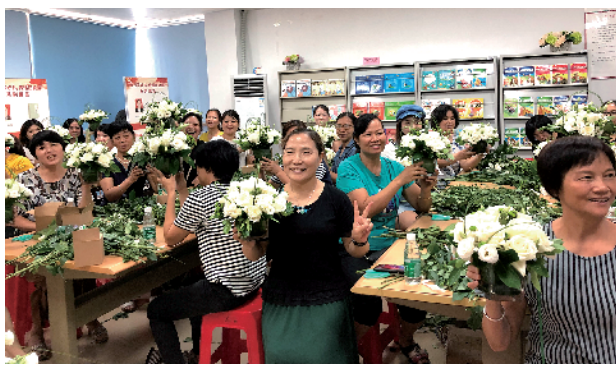
居民插花艺术活动广受社区居民欢迎