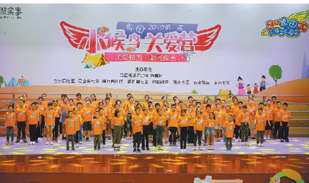
社区以慈善活力为着力点的多个关爱项目备受好评