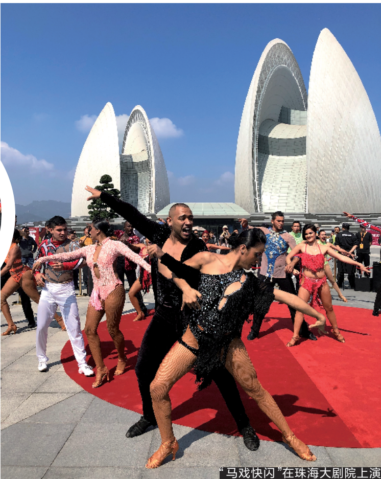
“马戏快闪”在珠海大剧院上演

据本次活动负责人介绍,本届马戏节是历届表演水平最高的一届,共有22个国家和地区的马戏表演团队上演24个重量级节目,其中包括7个国际马戏节金奖节目和8个国际马