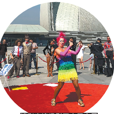
精彩表演吸引了大量市民

最吸引人的莫过于三场“马戏快闪”,每场将近半小时的马戏表演让人叹为观止。“马戏快闪”以动感热辣的南美舞蹈《燃烧萨尔斯》拉开序幕,11对来自哥伦比亚的俊男美女们以热情奔放的舞风瞬间吸引了周边的市民。据悉,这是长隆原创巨制《龙秀》的表演项目之一;来自摩纳哥的《男女对手》和法国的《探戈手技》,分别以一男一女的形式,