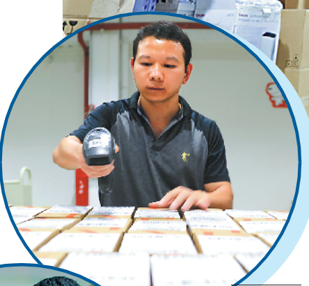
双11期间，斗门交出亮眼成绩单