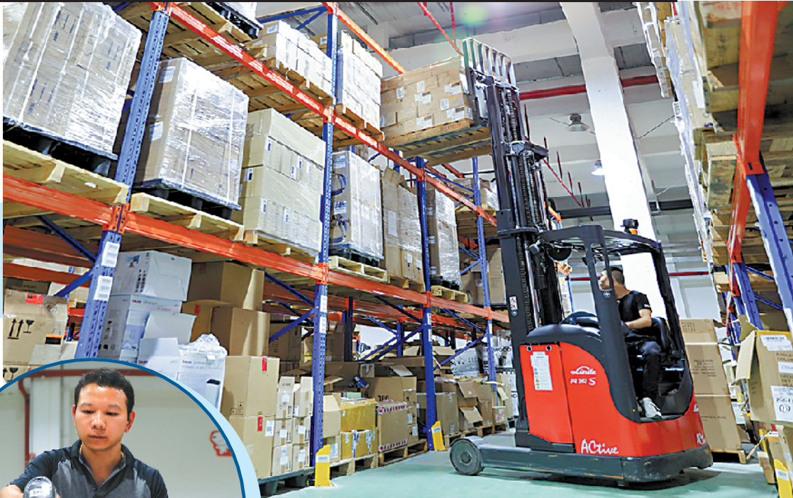
珠海斗门物流业发展势头良好

发展物流业对斗门农产品（鲜活产品）出口也是“福音”。斗门区是珠海市的农业大区，也是全国知名的海鲈鱼养殖之乡，依托目前正在建设的斗门白蕉现代农业（冷链物流）示范园和斗门港口岸，将白蕉海鲈等鲜活产品进行深加工、冷藏，可实现鲜活产品的生产、加工、仓储及配送、出口一体化。