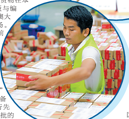
双11期间，斗门企业很忙碌

虽然优势明显，但珠海斗门区发展物流业也存在不小的挑战。斗门区科工信局相关负责人举例称，斗门港应对大桥通车后新形势，拟利用