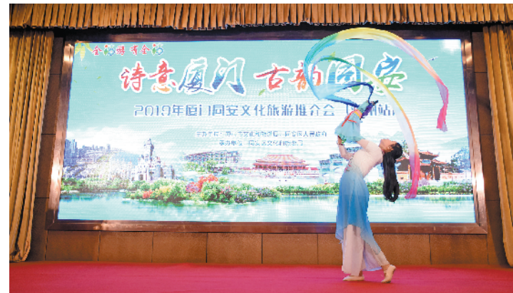
舞台上布袋木偶舞动长绸，以一曲《梁祝》惊艳四座，淋漓尽致地展现着同安传统民俗艺术的迷人魅力

羊城晚报讯 记者赵映光、王漫琪摄影报道：“千年同安，长街胜景；八闽集美，大道新风……”从 19 日起，2019“诗意厦门·生活同安”文化旅游推介会带着浓浓的文脉古风走进我省，相继在潮州、汕尾和广州举行，邀约我省广大市民共赴“古韵同安”，一同品味她的文脉之美。