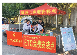
汕汾高速积极推广 ETC 免费安装

ETC 门架系统已进入最后攻坚阶段，门架系统工作人员正紧锣密鼓地进行系统部署和网络联调，计划于近日便可接入省、部联网收费中心，为明年 1 月 1 日的全国联网收费奠定坚实基础。届时，高速公路收费站拥堵的场景或许也将一去不复返。