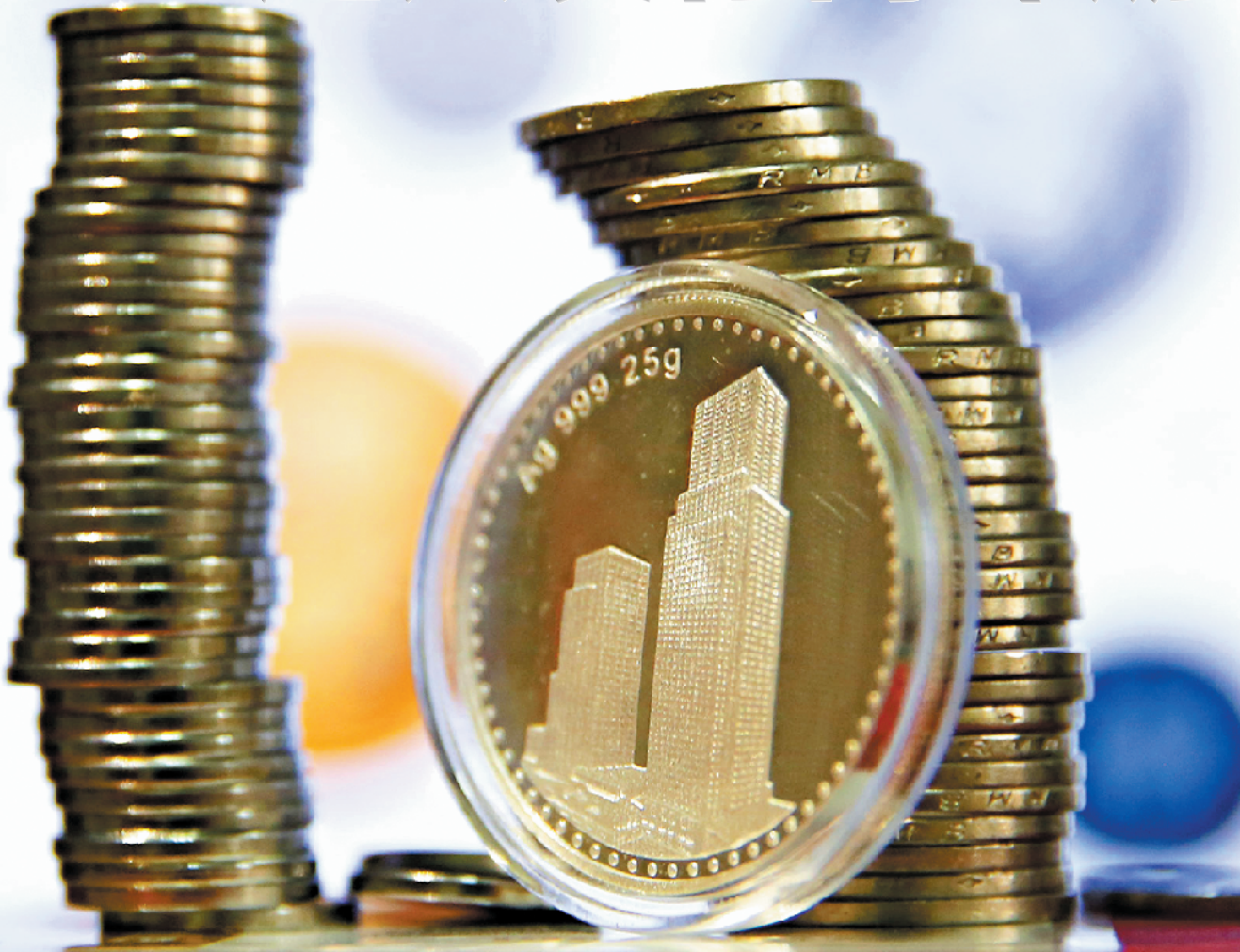
非人民银行发行的纪念币流通性和升值空间都不大