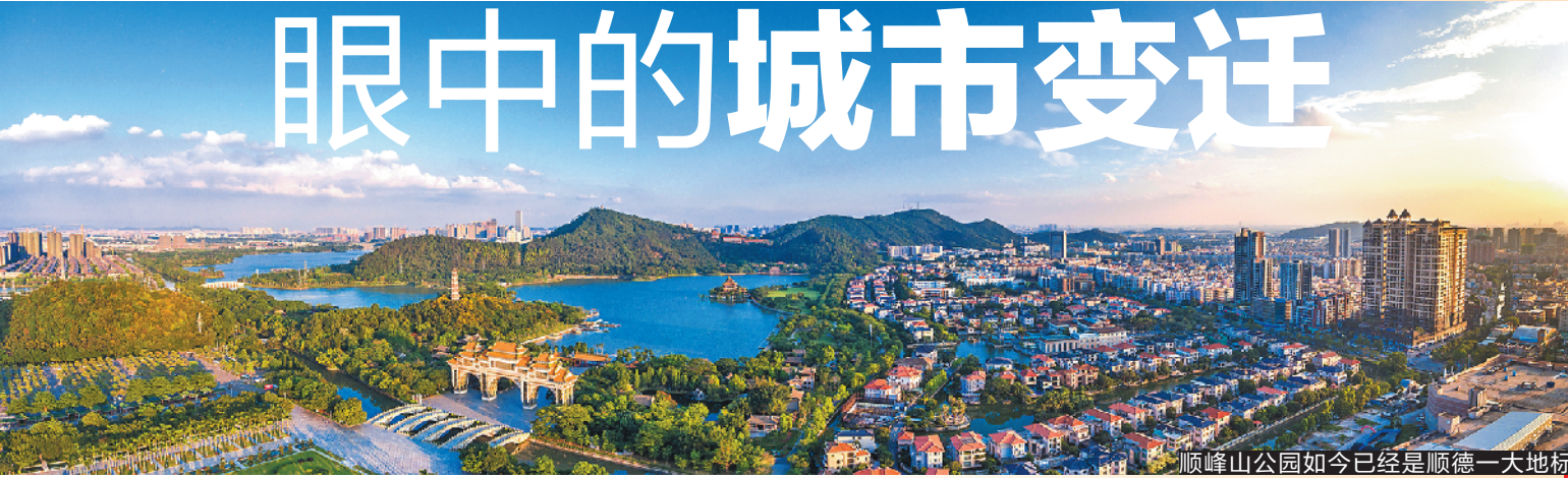
顺峰山公园如今已经是顺德一大地标