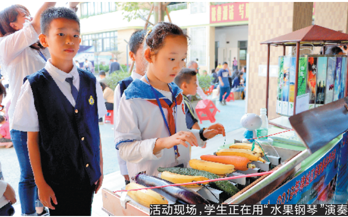
活动现场,学生正在用“水果钢琴”演奏

据介绍,本届嘉年华活动以“传承·创新·智造”为主题,吸引了3000多名来自佛山市内的师生及家长到场参与体验。