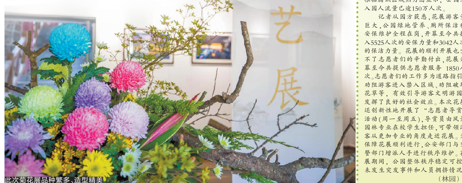
此次菊花展品种繁多、造型精美 制图/潘刚

菊花展期间,还将同步推出戏曲专场,共分7个专场,为市民带来粤剧、评剧、豫剧、越剧、黄梅戏、传统京剧和现代京剧等类型丰富的名家名段。此外,“古韵琴怀”百人古筝精英汇、《中国韵》旗袍服饰快闪、《武之韵》武术专场以及《小荷才露尖尖角》少儿文艺专场等精彩演出也将轮番上演。