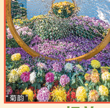
菊花展期间,还将同步推出戏曲专场,共分7个专场,为市民带来粤剧、评剧、豫剧、越剧、黄梅戏、传统京剧和现代京剧等类型丰富的名家名段。此外,“古韵琴怀”百人古筝精英汇、《中国韵》旗袍服饰快闪、《武之韵》武术专场以及《小荷才露尖尖角》少儿文艺专场等精彩演出也将轮番上演。

合的鲤鱼艺术造型相映成趣,展现了菊花倒映在水中的朦胧美,同时结合光影效果,分别展示阳光下、灯光下、月光下的菊花倩影。“菊韵”品种盆景展位于杜鹃园,展出独头菊、9朵菊、30朵菊、70朵菊及大小盆景菊,共计260余个品种。相较往年,今年的品种菊和盆景菊还增添了背景装饰,结合展示菊花诗词、山水图案的竹帘画和布画装饰,突显菊花的文化魅力,丰富菊花展的文化内涵。