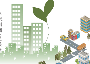
《2019 美国门户开放报告》显示国际学生增速放缓