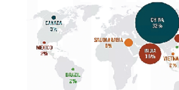
TOP TEN PLACES OF ORIGIN OF INTERNATIONAL STUDENTS

60% of international students come from China, India, Saudi Arabia, and South Korea.