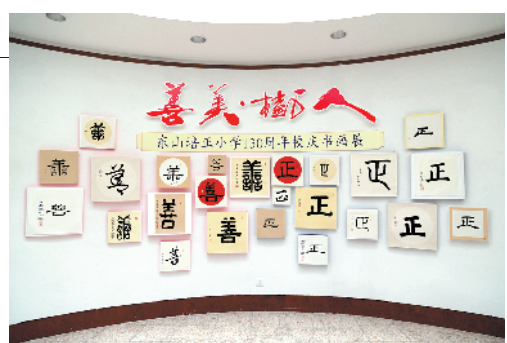
培正小学130周年书画展