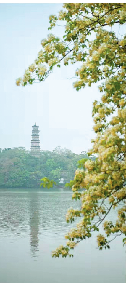
枝上春风

二十多年前的1996年，我和丈夫调到惠州工作。一路上这片土地，就喜欢在这里得天独厚的自然环境中，可美中不足的是，市里的道路太差！大街小巷很多地方都是坑坑洼洼的土路。在江北新区和河南岸片区，随处可见水塘和黄泥路。晴天尘土飞扬，雨天泥泞泞。当时把惠州比作“社会主义新农村”的那句调侃倒是有些契合。市内道路更与一个地级市的格局极不相称。