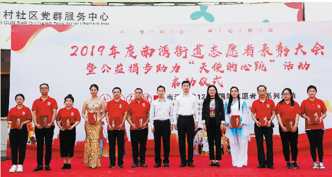
南湾街道表彰优秀义工、志愿者