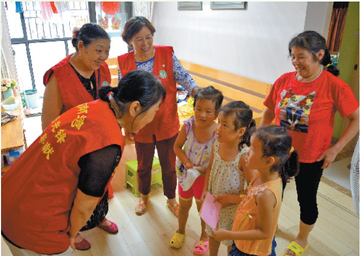
南湾志愿者在服务

“同样的爱心，不一样的精彩！”在第34届国际志愿者日来临之际，12月1日，龙岗南湾街道在南岭村社区文化广场举行了“12·5”国际志愿者日系列活动之2019年度志愿者表彰大会暨公益捐步助力“天使的心跳”活动。100名第一届“南湾百优义工”、10名优秀志愿者骨干及10个优秀志愿者团队受到了表彰。