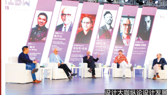
设计大咖论坛设计发展

12 月 9 日，是一年一度的中国设计日。昨日，“2019 中国设计活动日·广东工业设计城创意设计周”在顺德区启动。据悉，此次活动不仅云集全球各地的顶尖设计机构，还吸引业内知名人士探讨行业发展趋势，对接设计成果，促进工业设计产业的高端化、品牌化、国际化发展，为“顺德设计”高质量发展赋能。