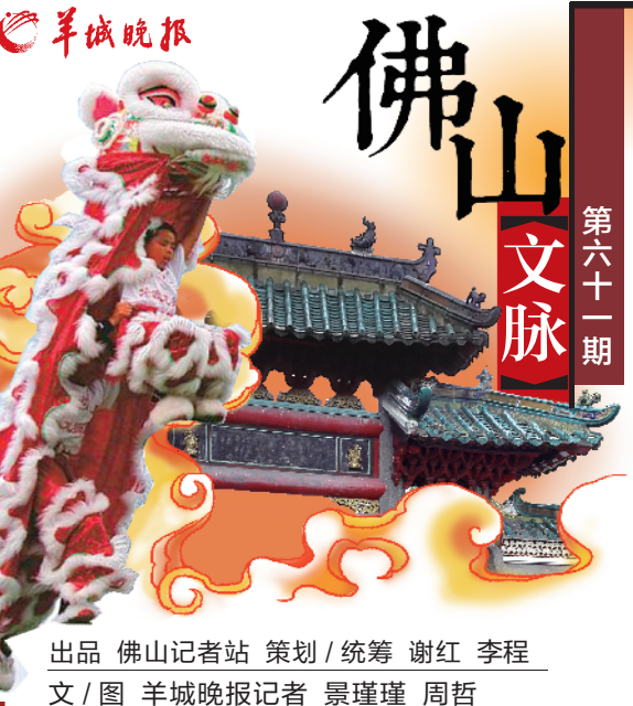
出品 佛山记者站 策划 / 统筹 谢红 李程 文 / 图 羊城晚报记者 景瑾瑾 周哲