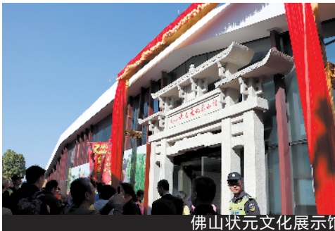
佛山状元文化展示馆

羊城晚报讯 记者景瑾瑾摄影报道：12 月 7 日，“读好书，走状元路”——桂城读书节启动，同时，佛山状元文化展示馆、有“最美读书驿站”之称的金融城广场读书驿站揭牌。本次活动由桂城街道办事处主办，桂城街道文化站承办。据了解，截至目前，桂城的读书驿站达到了 47 家。