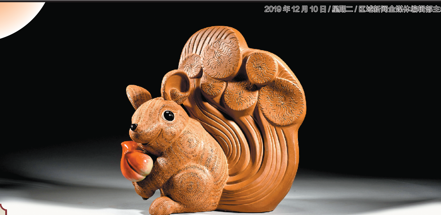
黄志伟陶艺作品《喜悦》