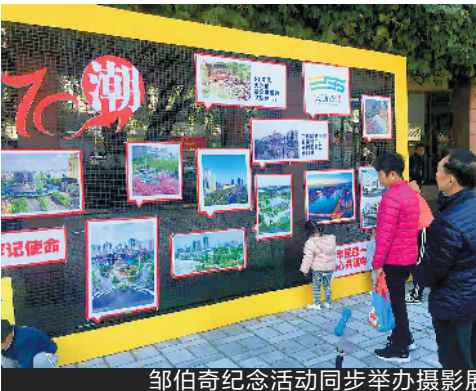
邹伯奇纪念活动同步举办摄影展

羊城晚报讯 记者张闻、通讯员刘成摄影报道：12 月 8 日，纪念邹伯奇诞辰 200 周年系列活动在大沥镇黄岐文化广场举行启动仪式，同期启动伯奇纪念馆项目，2019“伯奇杯”中国创意摄影展评审、邹伯奇诞辰 200 周年学术分享会相继举办。