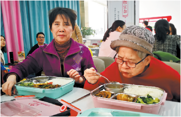
民治老人吃饭有了好去处