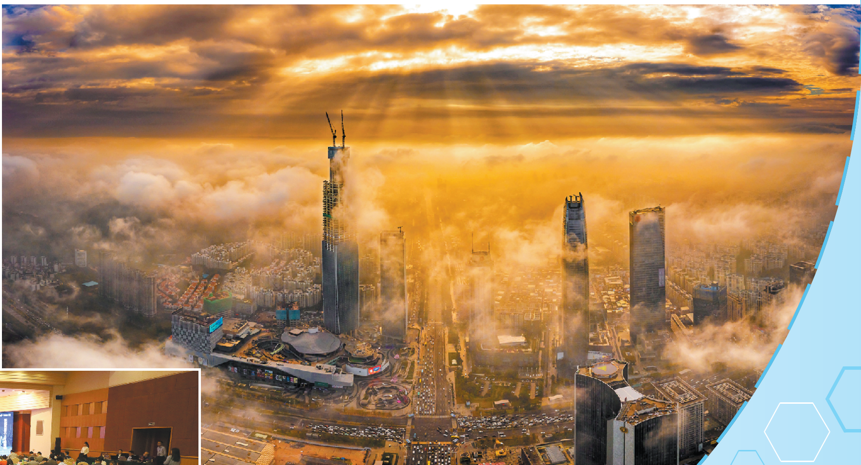
东城新兴产业投资活跃

自全国首个商事制度改革基地落地东城以来，东城深入梳理商事登记、食品药品等领域的行政审批事宜，压缩重复审批事项，多渠道搭建更加便民的服务平台，在东莞全市先试先行，进一步激发各类市场主体创新活力，营造良好营商环境，为“湾区都市、品质东莞”建设贡献东城力量。