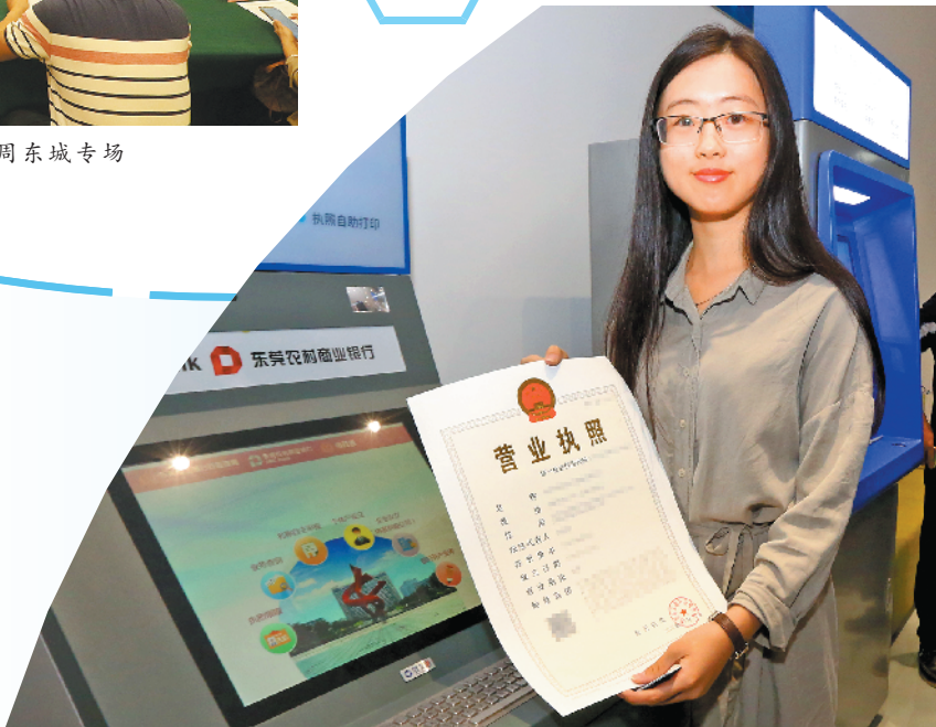
创业者办企业更便利了

随着准入环境的优化，东城街道市场主体持续活跃增长。今年5月17日，辖区市场主体总量突破9万户，全市位居第三。其中，今年新登记的市场主体数量接近1.8万户，更多初创企业选择落地东城，给东城市场注入新活力。另外，在东城的市场主体中，企业数近4.5万，个体户数近4.4万，这也是东城街道企业数量首次超个体户数，市场活力得到进一步激发。