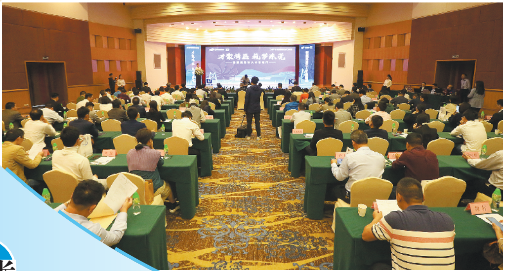
高层次人才活动周东城专场