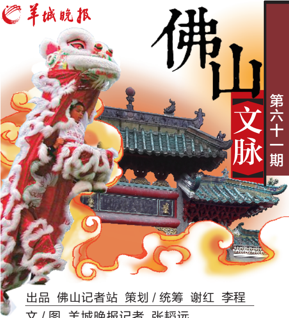
出品 佛山记者站 策划/统筹 谢红 李程 文/图 羊城晚报记者 张韬远

三水芦苞地处西江与北江之交汇处,自古便商船云集。小镇四周水网密布,对于当时的民众而言可谓是绝佳的建村之地。旧时,此地便有大