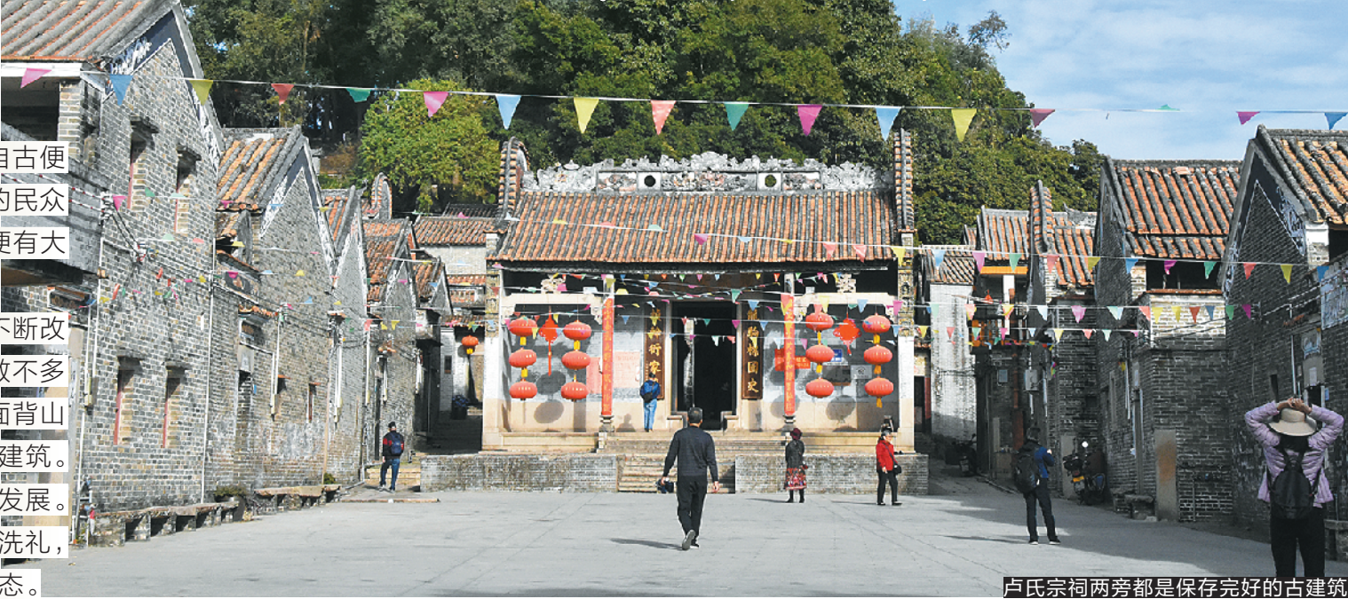
卢氏宗祠两旁都是保存完好的古建筑