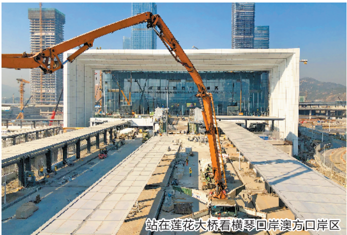
站在莲花大桥看横琴回岸澳方口岸区