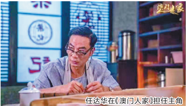
任达华在《澳门人家》担任主角