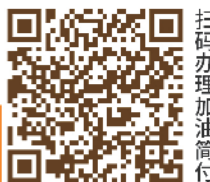
扫码办理加油简付

加油简付 | 开通加油简付，免费获赠RFID标签，体验即加即付即走的加油体验，更享兴业银行专属理财产品和加油满减等多重优惠。