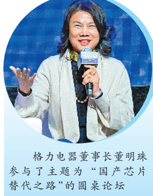
格力电器董事长董明珠参与了主题为“国产芯片替代之路”的圆桌论坛

中国半导体行业协会常务副秘书长官承和表示,珠海先进集成电路创新研究院的成立揭牌,这契合了珠海集成电路产业的发展需求,对于提升珠海集成电路设计产业的整体水平,集聚相关产业的优秀人才,打造自主可控的新一代信息技术产业体系具有重要意义。希望以此为契机,进一步构建珠海集成电路核心产业集群和完整产业生态,