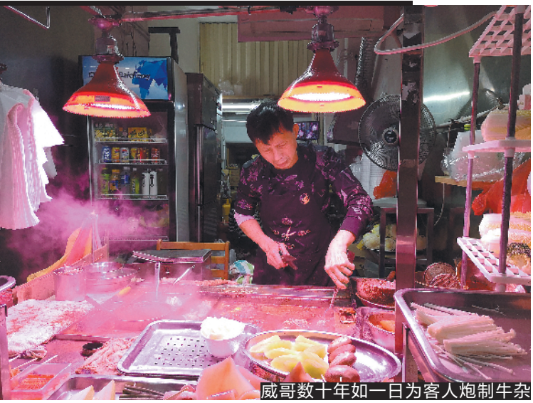
威哥数十年如一日为客人炮制牛杂

而在排队之际,笔者还看到两位拖着拉杆箱的游客专程过来等候。不知道他们是刚到澳门吃