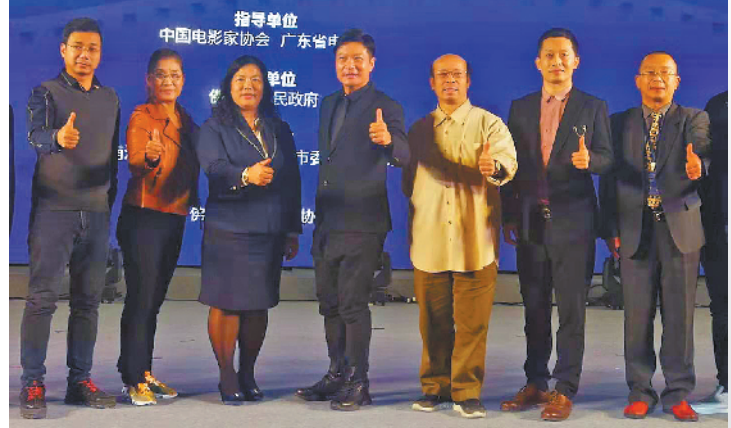
功夫动作演员人才培养主题论坛,嘉宾集体点赞