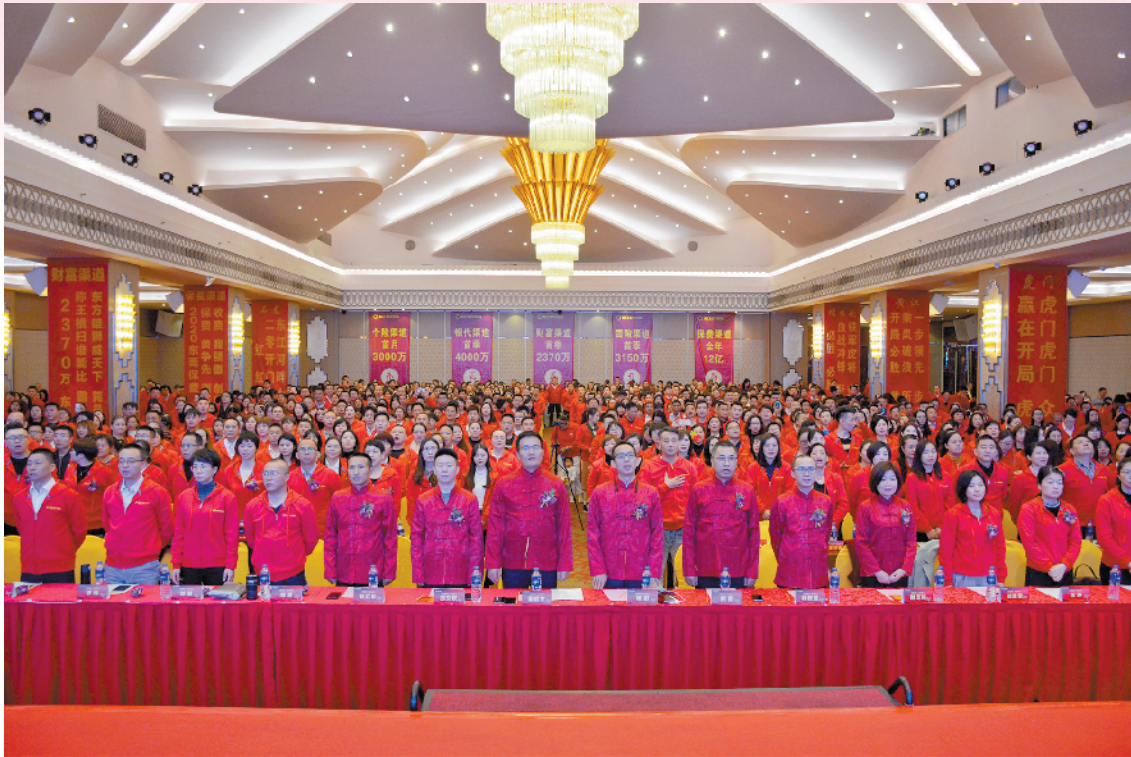
保险公司开门红大幕拉开

据悉，本届“1.08财神节”以“我的新年钞能力”为主题，将于2019年12月24日上线并持续至2020年1月29日结束。多元化、一站式，是平安“1.08财神节”一直以来带给金融消费者的服务体验。本届“1.08财神节”针对客户需求，推出了“年终理财”“合家健康”