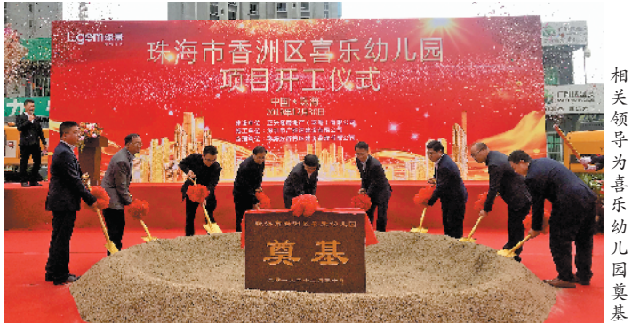
相关领导为喜乐幼儿园奠基

在幼儿园的建设上，香洲区结合实际，“特事特办”“来者不拒”。审批前沟通协商、审批中高效办理、审批后跟踪服务，以最短的时