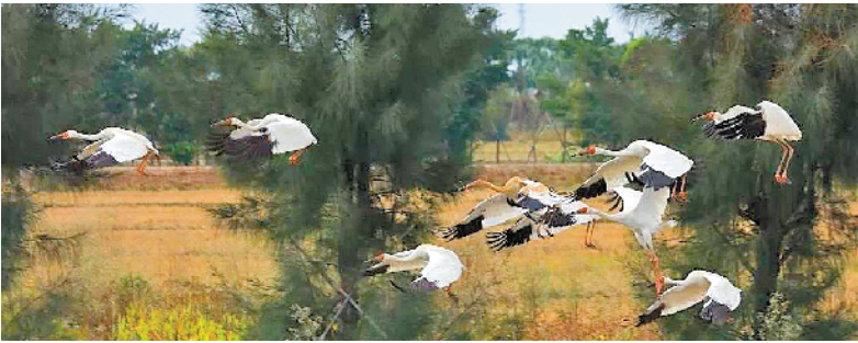
白鹤在沙仔场翱翔

今年12月8日，有观鸟爱好者在沙仔场发现有一群以前没有见过的候鸟。12月11日，广东省林业局组织广东省生物资源应用研究所等方面专家前来开展现场调查，确认这是广东省历史上首次观测记录到国家一级保护野生动物——白鹤。 记者了解到，近年来，候鸟冬季迁往江门的数量庞大。仅在新会银湖湾湿地一带，据银湖湾管委会观察和初步统计，每年就有约4万只候鸟到这里过冬。不仅数量庞大，其中不少还是珍贵品种，如此前观测到的国家二级重点保护动物黑翅鸢、黑脸琵鹭等。此次发现的白鹤，让江门冬季候鸟迁徙盛会上再增“贵宾”。 江门观鸟爱好者雷磊说，以往江门观鸟拍摄的地方集中在新会小