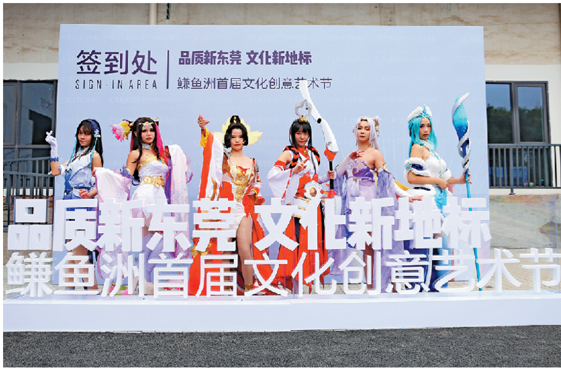
鯇鱼洲首届文化创意艺术节启动仪式举行

东实在保留鯇鱼洲原生工业风貌的基础上,对鯇鱼洲进行品质与功能化的提升,使得鯇鱼洲焕发新生命力。在克服了重重困难,经历了近一年的规范建设和推广招商之后,2019年12月31日,鯇鱼洲文化创意产业园宣布正式对外开放,未来将重点布局“产业、文化、旅游、商业”四大业态,打造“东莞文化新地标”。