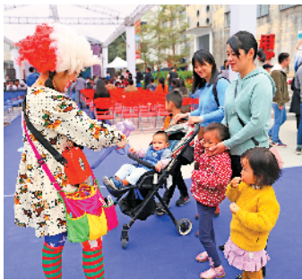
鯇鱼洲文化创意艺术节现场

“鯇鱼洲地处‘三江六岸’滨水地区的核心位置,同时作为东莞最具特色的工业遗址之一,鯇鱼洲工业遗存改造和活化利用工程项目是‘三江六岸’开发建设的突破点,也是东莞市城市品质三年提升计划的示范项目。”东莞市自然资源局党组书记、中心城区“一心两轴三片区”建设现场指挥部副指挥长黄宇东在致辞中说,在东实集团的努力下,沉睡多年的鯇鱼洲“活”了起来,不仅让悠久的岭南水乡底蕴、工业历史文化得以展现,还有了新活力、新魅力。他表示,希望东实集团能够继续努力,完善鯇鱼洲文化、休闲、娱乐、旅游和商业等公共服务设施建设,打造优质的滨水公共活动空间网络,将