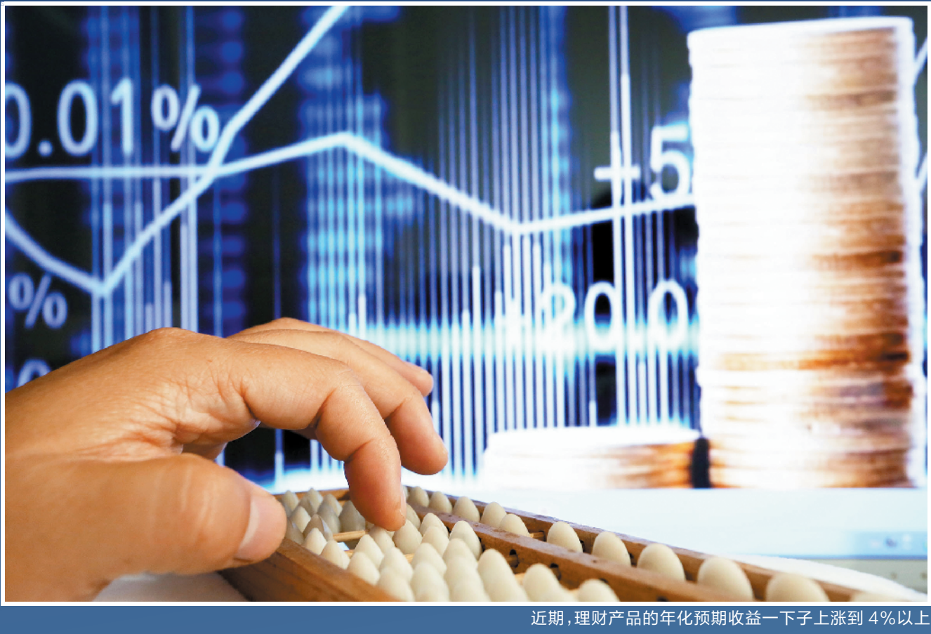
近期,理财产品的年化预期收益一下子上涨到4%以上

文/周晓玲 图/王俊伟 元旦节前,各银行理财产品收益如期来个“大翘尾”,不少理财产品收益站上“4”字头。元旦之后,“4”字头理财产品仍有不少。对于稳健性的投资者来说,此时购买理财产品锁定收益,也是不错的选择。