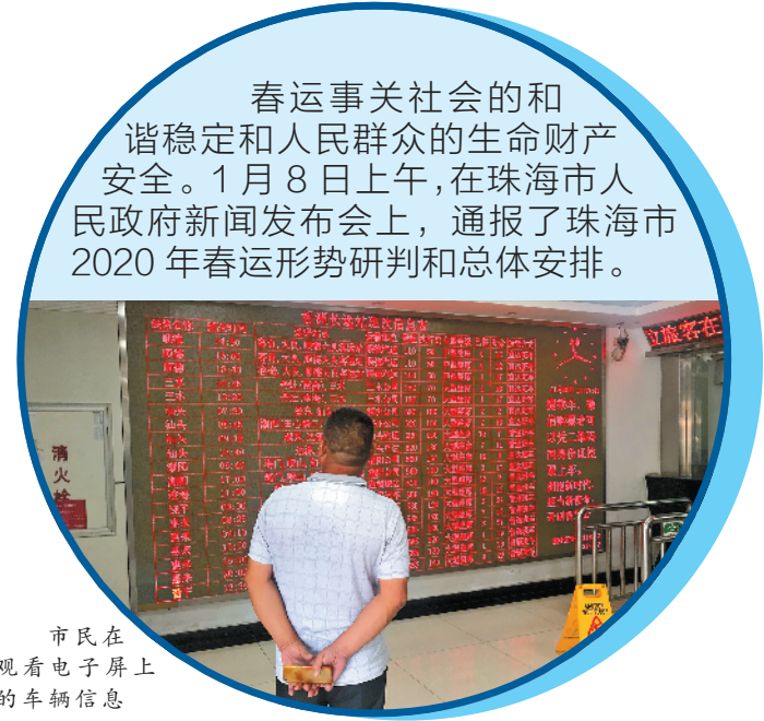
市民在观看电子屏上的车辆信息