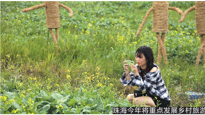
珠海今年将重点发展乡村旅游

据介绍，今年珠海在乡村产业高质量发展方面主要抓三个重点：建设美丽乡村，打造大湾区乡村旅游目的地；建设现代农业产业园，打造大湾区优质农产品供应中心；建设高标准国际渔业物流港，打造大湾区海洋经济发展新引擎。