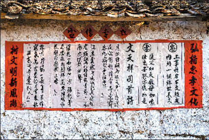
龙塘村内毛笔书写的文天祥诗词

由此看来,这文氏三兄弟是各在一个层面上发力,共同圆满了儒家的家国情怀、忠孝节义!