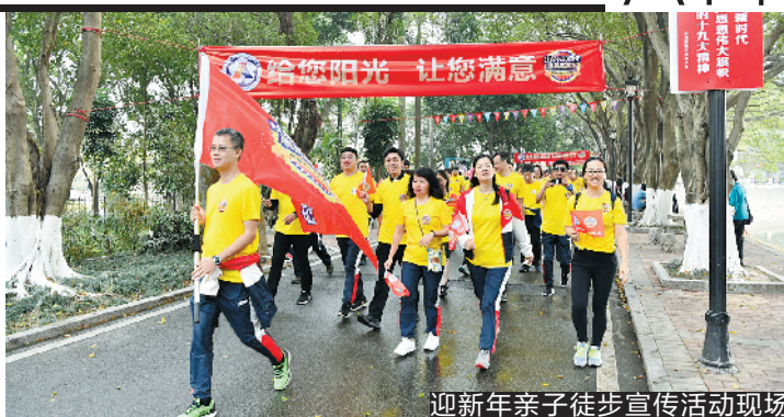
迎新亲子徒步宣传活动现场