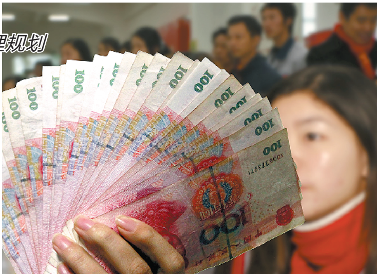
面对年终奖,不少人都会产生消费冲动

若年终奖金额较多,则建议按照时间段来规划资金,对于过年期间就要用到的资金,可考虑购买货币基金,对于两三个月不需要用到的资金,可以考虑购买银行理财产品。目前,银行理财产品的收益相对要高一些,年化预期收益大约4%,投资期限在2个月到3年之间可选。如短期内需要用到资金,可以选择广发银行“薪满益足”薪金享C款,起购金额1万元,投资期限为63天,年化预期收