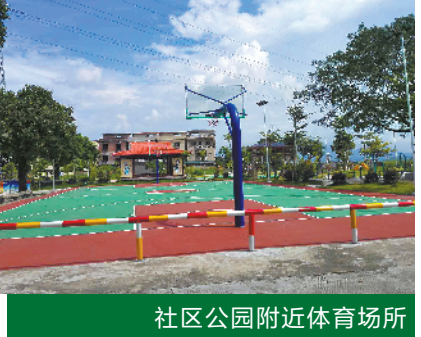
社区公园附近体育场所