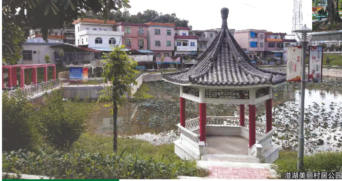
莲湖美丽村居公园

过车流密集的莲湖路和宽阔的东深供水渠道，交通颇为不便。沿路的厂房低矮、老旧，多为小型的塑胶五金及手机零配件企业，土地集约利用率不高、产出效率低等。 2019 年，东莞市全面实施乡村振兴战略，全域推进农村人居环境整治，建设生态宜居美丽乡村。桥头社区的发展进入新时代。根据相关行动方案和创建指引，桥头社区等 4 个村（社区）被作为桥头镇创建东莞市特色精品示范村的试点村。根据桥头社区特色精品示范村创建方案，该社区将编制村庄建设规划，明确突出村容村貌提升以及文化特色、生态建设、产业发展、风貌整饰等要求。