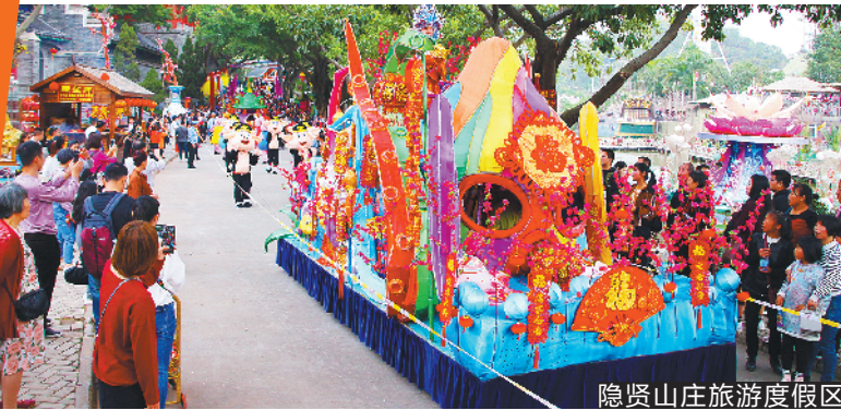
隐贤山庄旅游度假区

为了将欢乐传递给更多的人群，将隐贤山庄祝福送给每一个游玩的游客，景区在春节期间还将开启“万元抖音大赛”“朋友圈集赞送套票”“航拍大赛”“欢乐摇钱树”等多个有奖活动环节。不仅能携手全家出游体验春节的乐趣，还能让游客在隐贤山庄的游玩中讨到一个好的彩头。（常思雯 杨文）