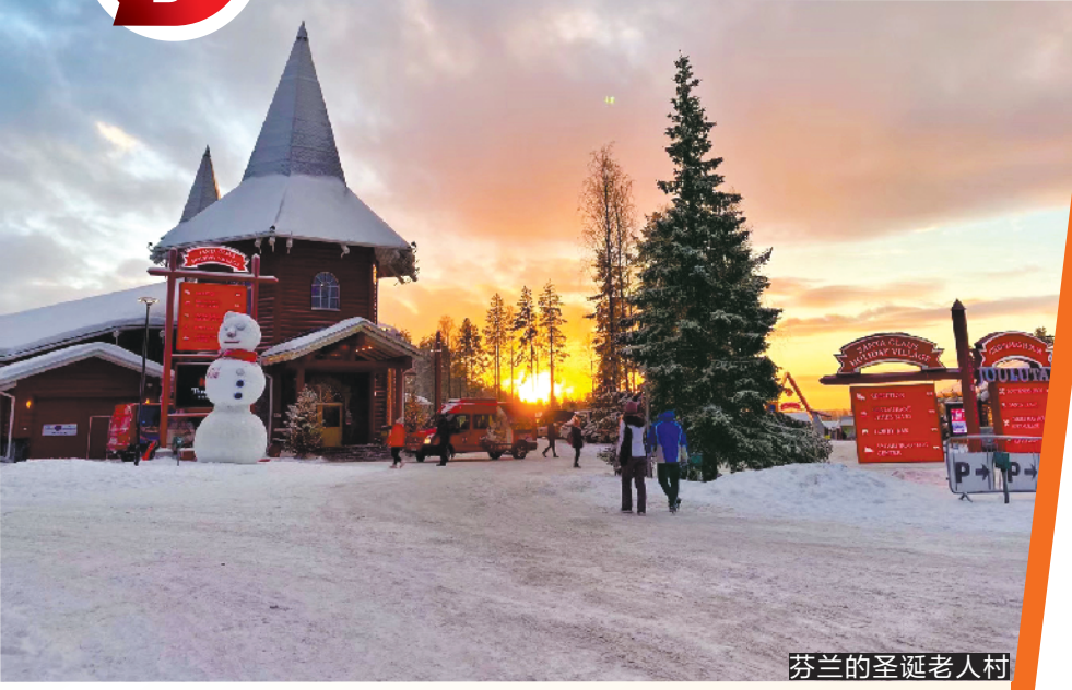
芬兰的圣诞老人村

笔者从一家旅游在线平台了解到，以日本 6 日 5 晚的一款旅游产品为例，大年初一出发价格高达 1.6 万元，元宵节后出发的售价不到 1 万元，春节出游的价格涨幅超 50%。而一款泰国曼谷 6 日 5 晚的半自助游产品，大年初一出发价格在 7000 元，而元宵节后的售价不到 2500 元。据某旅游平台的数据显示，2019 年度出境游消费同比增长超 25%，三线及以下城市出境游人次增幅超 30%，增速超过一二线城市。“00 后”的出境群体正快速扩大，出境游人次同比增幅近 200%。