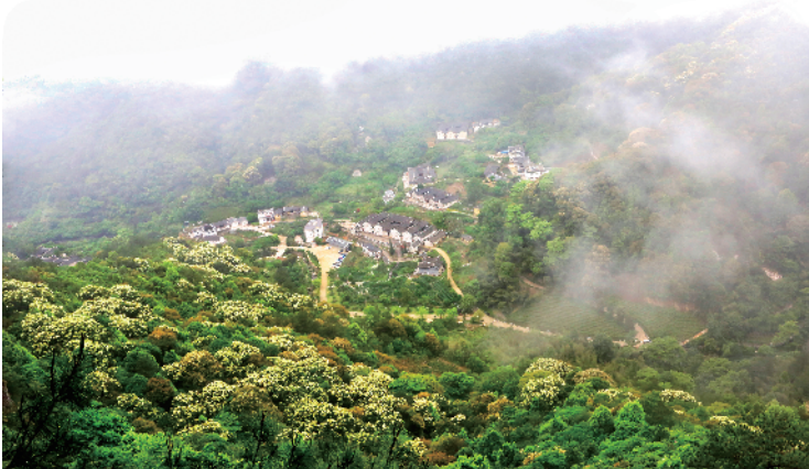
梅县区雁洋镇桥溪古村落

力度,推动“三清三拆三整治”工作落到实处;平远县将农村人居环境整治问题在全县曝光,并在县委常委会议上进行通报,责成有关单位限时整改落实并向县报送整改情况;其他县(市、区)也分别通过设立举报热线、聘请百姓监督员等做法加强对农村人居环境整治工作的监督,提升广大群众参与度。通过市级带头,以上率下,充分发挥媒体和群众监督作用,营造全民参与的浓厚氛围,凝聚起推动乡村振兴工作的强大合力。