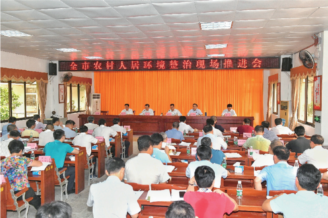
2019年7月,全市农村人居环境整治现场推进会会议现场(梅县区桃尧镇)

村振兴实绩考核。通过建立信息报送机制,畅通信息快车道,进一步加强了全市乡村振兴工作统筹力度,及时掌握各县(市、区)、各相关部门推进乡村振兴工作情况,尤其是关于对标三年取得重大进展硬任务的落实情况,确保了全市上下信息畅通。