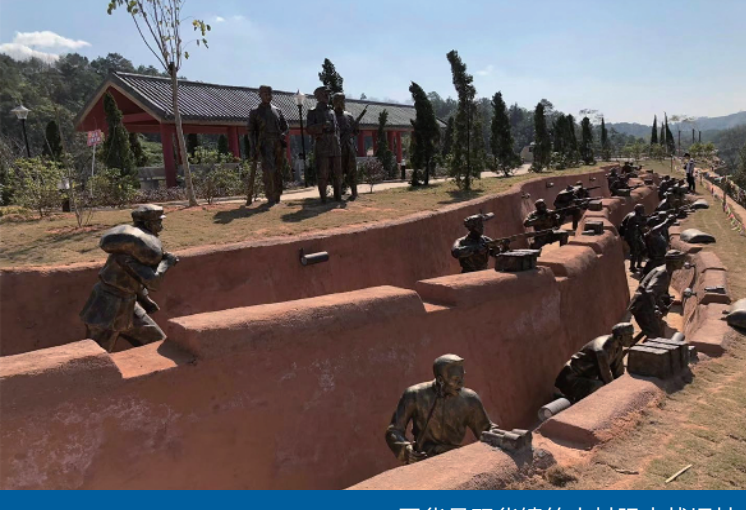
五华县双华镇竹山村阻击战旧址