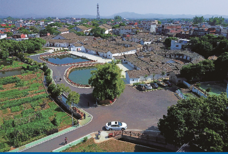
兴宁市龙田镇龙盘村岭下广场