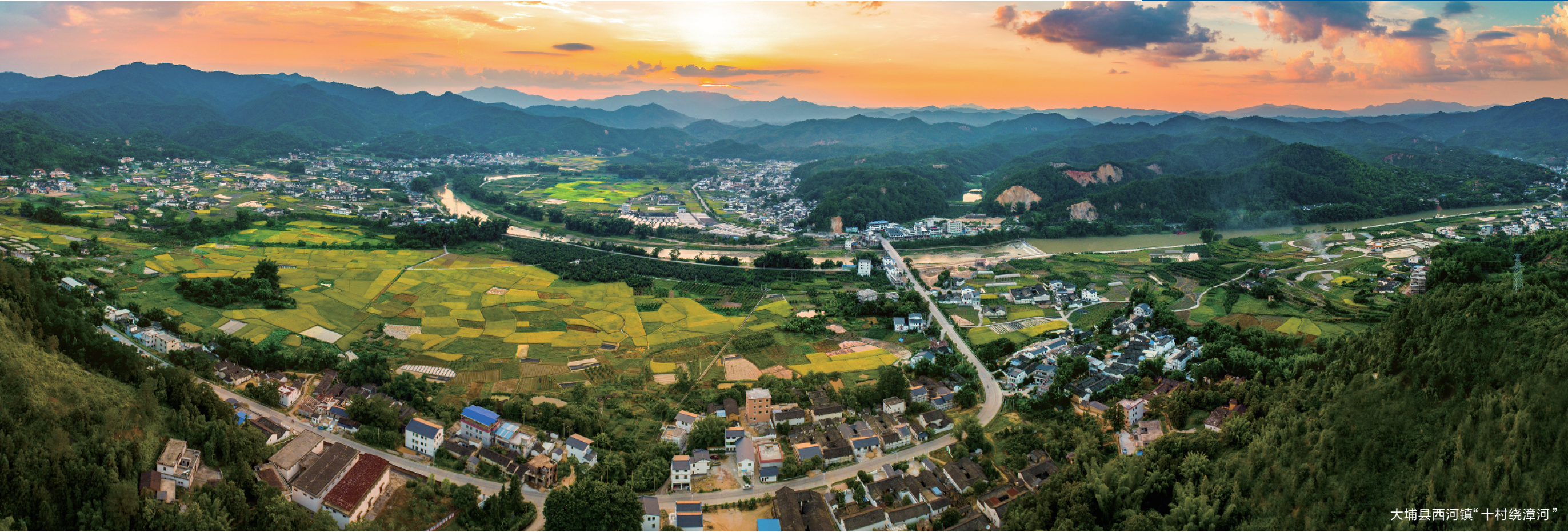
大埔县西河镇“十村绕漳河”