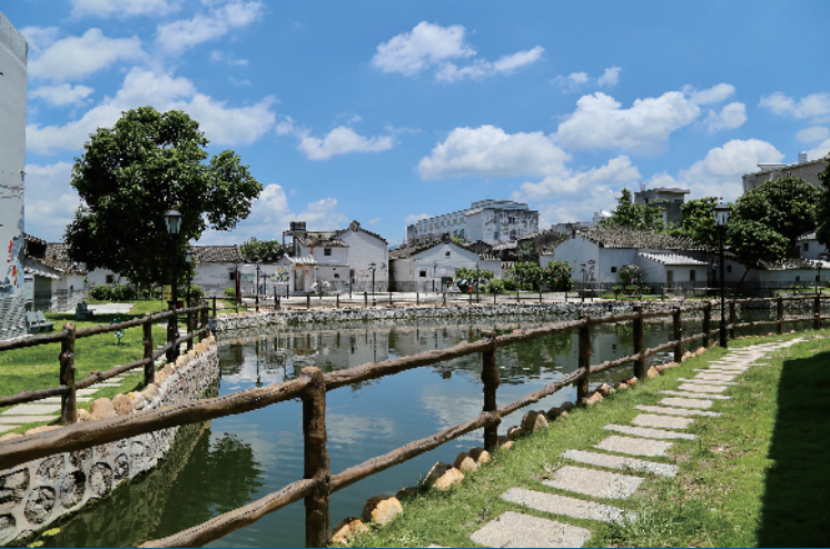
丰顺县汤南镇新楼村牛厝池

激励各县(市、区)和市直相关单位互学互比互促,推动落实硬性指标任务要求,凝聚起共同推进乡村振兴工作的强大合力。