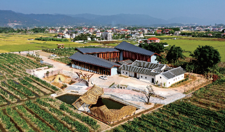
蕉岭县蕉城镇龙安村乡建馆