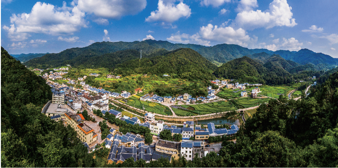
平远县上举镇上举村

信息,交流经验,互比互学,取长补短,共同提高,从中也发现了一些工作亮点和创新做法。如,梅县区推行“地票制”的做法,得到中央电视台《焦点访谈》节目专题报道。